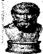
Епікур 342-270 рр. до н.е.

На заключному етапі давньогрецької філософії опиняються проблеми етики, зокрема щастя і смислу життя. Значного поширення