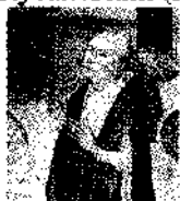
Микола Кузанський 1401 - 1464 рр.

Відомим мислителем раннього Відродження є Микола Кузанський (Кребс). Основні твори: «Про незнання», «Про злагоду віри» та ін. Філософ в новому дусі трактував ідеї неоплатонізму. «Єдине», на його думку, охоплює все, воно не має нічого протилежного собі. Звідси парадоксальний, але логічний висновок: «єдине» - тотожне безконечному. Згідно з цим твердженням одиниця, єдине (мінімум) і безконечне (максимум) збігаються. Іншими словами, безконечність можна мислити як єдине, а єдине - як безкінечність. Розгор-