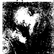
Геракліт 540-475 рр. до н.е.

Людська душа проходить через низку втілень (інкарнацій) у різні живі істоти, завдяки чому вона очищається і вдосконалюється. Очищення (катарсис) душі задля її вдосконалення є центральним завданням вчення Піфагора, що поєднує його філософські принципи, релігійні настанови, політико-моральні доктрини, наукові пошуки.