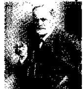
Зигмунд Фрейд 1856-1939 рр.

Ірраціоналістичні тенденції «філософії життя» продовжує та поглиблює психоаналітична філософія. Її емпіричною базою став психоаналіз. Психоаналіз – вчення, в основі якого лежить визнання домінуючої ролі підсвідомого в житті людини. Основоположником психоаналізу є З. Фрейд. Його основні праці: «Тотем і табу», «Я і