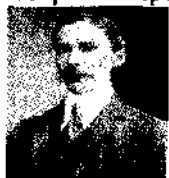
Бертран Рассел 1872 - 1970 рр.

Яскравим представником цього періоду є Бертран Рассел. Його перу належать такі твори: «Наше пізнання зовнішнього світу», «Людське пізнання: його обсяг і межі», «Історія західної філософії» та інші. Сутність філософського пізнання полягає не в проясненні філософської термінології, а в систематичному розумінні навколишнього світу. Логічний аналіз може сприяти філософському пізнанню тільки тоді, коли він спира-