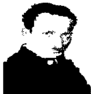
Мартін Гайдеггер 1889 - 1976 рр.

Сутність другого екзистенціалу – «розуміння» полягає в тому, що утягнута в буття (покладена) людина знаходить себе, «перезнаходить» себе у світі, в певному місці, в певний час. Людина виявляє, що вона є засобом розуміння. Існуюча у світі людина стає розуміючою, а розуміння реалізується завдяки тлумаченню та інтерпретації. Отже, людське буття споконвічно герменевтичне. Мислитель обстоює по-