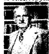
Джон Дьюї 1859 - 1952 рр.

Істинні ті концепції, ідеї і теорії, що є результативно-вигідними, плідно працюють у життєво важливих обставинах, ведуть до досягнення прагматичних цілей. Дьюї прив'язує істину до тієї ситуації, в якій вона з'явилась, і не вважав за можливе поширити її повноваження за межі даної ситуації. Але кожна ситуація унікальна, і