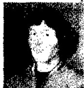
Микола Коперник 1473 - 1543 рр.

Революційним щодо усвідомлення місця людини в світі, в системі «людина – природа – Бог» було геліоцентричне вчення Миколи Коперника. Його твори «Малий коментар», «Про обертання