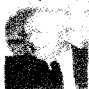
Карл Поппер 1902 - 1994 рр.

«Логіка наукового відкриття». Його перу також належать такі роботи: «Відкрите суспільство та його вороги», «Об'єктивне знання» та інші.