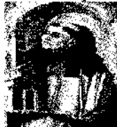
Фома Аквінський 1225 - 1274 рр.

Наступним періодом в розвитку середньовічної філософії називають схоластику. Схоластика (лат. учений, шкільний) – релігійно-філософське вчення, що, на противагу містици, вбачали шлях досягнення Бога в логіці та дискурсі. Яскравим представником даного періоду середньовічної філософії – Фома Аквінський. Його