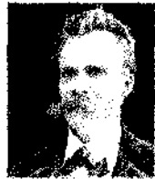
Фрідріх Ніцше 1844-1900 рр.

Філософські традиції Шопенгауера продовжив представник біологічно-натуралістичного варіанту «філософії життя» Ф. Ніцше.