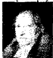
Георг Вільгельм Фрідріх Гегель 1770 - 1831 рр.

Вищим досягненням німецької класичної філософії є вчення Г.В.Ф. Гегеля, який увійшов в історію філософію як творець найрозгорнутішої і найобґрунтованішої системи ідеалістичної