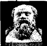
Сократ 469-399 рр. до н.е.

Другий етап у розвитку давньогрецької філософії позначений поворотом інтересу мислителів від космосу, світу до людини.