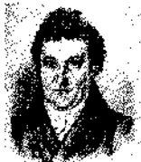
Йоган Готліб Фіхте 1762 - 1814 рр.

вірними самі собою. Таким достовірним фактом є визнання суб'єктом свого існування - «Я». «Я» охоплює собою все, що може бути мислимим. Акт самоусвідомлення є водночас актом самотворення. Отже, другий акт - «Я є не-Я» (антитеза). «Не Я» виступає як об'єкт, який обмежує свободу «Я». Теоретична філософія, усвідомивши місце «Я» і «не-Я», протиставляє їх одне одному в межах абсолютного «Я», неначе результат обмеження, розділу абсолютного. Третій акт (синтез) - «Я є Я і не-Я» - є зняттям протилежності суб'єкта і об'єкта, ствердженням їх тотожності. Досягнення цієї тотожності виноситься на безкінечність. Це ідеал до якого людина постійно прямує.