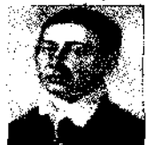
Григорій Сковорода 1722-1794 рр.

1. Учення про дві натури та три світи. Все існуюче, на думку Сковороди, поділяється на три специфічні види («світи») – великий (макрокосм), малий (мікрокосм) і символічний (Біблія). Великий світ – це світ речей, Всесвіт. Людина, мікрокосм – це центр, в якому сходяться і набувають свого значення усі символи макрокосм і Біблії. Третій світ – світ символів, або Біблія, виступає як самостійна реальність, яка забезпечує людині можливість досягнення Бога. Через