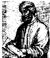
Квінт Тертулліан 160 - 220 рр.

Першою спробою філософського обґрунтування християнства була патристика. Патристика (лат. батько) – сукупність філософських доктрин християнських мислителів (отців церкви) II-VII ст. Одним з відомих його представників є Квінт Тертулліан. Його: