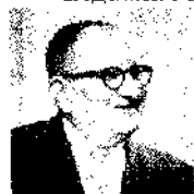
Етьєн Жільсон 1884 - 1978 рр.

Найбільш впливовою релігійно-філософською течією сучасності є неотомізм. Прибічники цього напрямку називають своє вчення «віковичною філософією», оскільки вона сягає 700-літньої давнини. Теоретичним фундаментом неотомізму служить схоластична філософія Томи Аквінського.