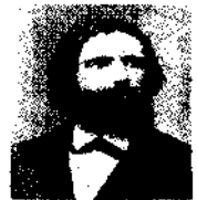
Франц Brentano 1838 - 1917 рр.

Феноменологічний напрямок у філософії розробляв Ф. Brentano.