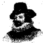
Френсіс Бекон 1561 - 1626 рр.

Засновником емпіризму є Френсіс Бекон. Найвідоміші праці: