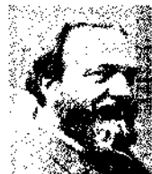
Ріхард Авенаріус 1843 - 1896 рр.

У працях «Критика чистого досвіду», «Людське поняття про світ» та інших, Р. Авенаріус розробив учення про «принципову координацію» («без суб'єкта немає об'єкта і без об'єкта немає суб'єкта»), згідно з яким заперечується об'єктивна реальність, що існує поза межами нашої свідомості. Тобто всі явища, які вивчаються (об'єкти), існують не інакше як у координації з суб'єктом. Для людини немає сенсу визнавати існування поряд з суб'єктом незалежного від нього об'єкта. Пізнання, за Авенаріусом підпорядковане не знанню про об'єктивну реальність, а досягненню біологічно доцільної найменшої витрати сил.