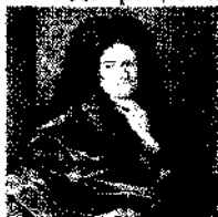
Вільгельм-Готфрід Лейбніц 1646 - 1716 рр.

Ідеї раціоналізму розвивав також Вільгельм-Готфрід Лейбніц.