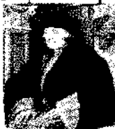
Еразм Роттердамський 1466 - 1536 рр.

Критика схоластичної псевдомудрості яскраво проглядається у творчості Еразма Роттердамського. Найвідоміший твір «Похвала глупоті». Характерне для гуманістів протистояння середньовічній схоластиці досягає у цій книзі кульмінації. Світовідчуття Еразма Роттердамського ґрунтується на двох тезах: 1) парадоксальна двоїстість усіх явищ буття та 2) згубність будь-якої одержимості, що межує з інтелектуальною запліпленістю.