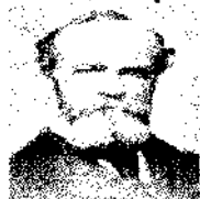
Уільям Джемс 1842 - 1910 рр.

Ідеї Пірса розвиває У. Джемс. Основні твори: «Принципи психології», «Різноманітність релігійного досвіду», «Плюралістичний всесвіт» та ін. Всесвіт, за Джемсом, складається з первісно «нейтральної речовини», яка у процесі її пізнання і «обробки» диференціюється на «фізичне» та «психічне», на свідомість і матерію. Дійсність безмежно багатоформна, плюралістична. Всі явища і факти поєднані лише зовнішніми функціо-