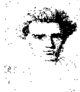
Сьорен К'єркегор 1813 - 1855 рр.

Джерела сучасного екзистенціалізму сягають ХІХ ст., вони пов'язуються з іменем С. К'єркегора. Основні його твори: «Страх і