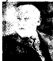
Вільгельм Дільтей 1833 - 1911 рр.

«розуміння» як безпосереднього осягнення певної духовної цілісності (цілісного переживання). Розумінню, що близьке інтуїтивному проникненню в життя, Дільтей протиставляє метод «пояснення», що