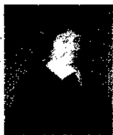
Рене Декарт 1596 - 1650 рр.

передумову пізнання. Суть дедуктивного методу Декарт сформулював у чотирьох правилах. 1. Піддавай усе сумніву! За істинні можна вважати лише ті положення, які не викликають ніякого сумніву і не потребують доведення. 2. Кожну складну проблему слід ділити на простіші (аналіз) і робити це доти, доки не прийдемо до ясних та очевидних речей. 3. Треба «дотримуватися певного порядку мислення», починати з найпростіших і доступних для пізнання предметів і поступово сходити до складніших і важчих. 4. треба орієнтуватися на досягнення повноти знання, на послідовність та реальність дедуктивного виведення, мати повний перелік і детальний огляд усіх ланок. Розум, озброєний дедуктивним методом, здатний пізнати найглибші основи світу і не може мати перешкод у своєму сходженні до істини.