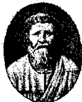
Августин Блаженний 354 - 430 рр.

Відомим християнським теологом, філософом, представником