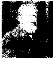
Едмунт Гуссерль 1859 - 1938 рр.

Творцем і відомим представником феноменології є Е. Гуссерль.