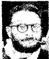
Клод Леві-Стросс 1908 – 20__ рр.

Засновником структуралізму є К. Леві Стросс. Основні роботи: