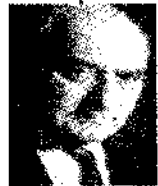
Гельмут Плеснер 1892 - 1985 рр.

Проблеми філософської антропології розвивав також Г. Плеснер.