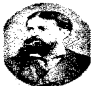
Чарльз Пірс 1839 - 1914 рр.

Засновник прагматизму Ч. Пірс. Основні твори: «Зібрання статей» у 8-ми томах, «Листи до леді Велбі». Пірс вважав, що поняття про об'єкт можна досягнути лише шляхом розгляду всіх практичних наслідків, які випливають із дій з цим об'єктом. Наше знання про об'єкт завжди залишається гіпотетичним. Навіть математичні та логічні судження можна заперечити контр-прикладними.