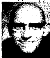
Мішель-Поль Фуко 1926 – 1984 рр. епістемами.

Ідеї структуралізму розвивав також М.-П. Фуко. Основні твори: