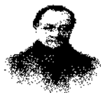
Огюст Конт 1798 - 1857 рр.

Засновником позитивізму є Огюст Конт. Йому належить 6-томний «Курс позитивної філософії», «Система позитивної політики». Згідно з вченням Конта, філософія не є наукою із власним об'єктом, що якісно відрізняється від об'єктів конкретних наук. Філософія узагальнює досягнення конкретних наук, або ж є узагальненою класифікацією всіх наук. Позитивізм як філософський напрям заснований на принципі: справжнє знання