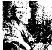
Жан-Поль Сартр 1905 - 1980 рр.

Нові ідеї в екзистенціальну філософію привніс Жан-Поль Сартр.