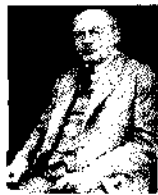
Макс Шелер 1874 - 1928 рр.

Філософська антропологія – вчення про природу (сутність) людини, яке виводить культуру зі специфіки природи людини. Одним із її засновників був М. Шелер. Водночас Шелер був творцем аксіології – філософської теорії цінностей. Його основні твори: «Про