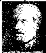
Аристотель 384-322 рр. до н.е.

Величезний вплив на подальший розвиток європейської філософської думки здійснив Аристотель. Його відомими працями є: