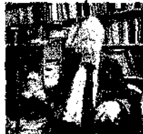
Ганс-Георг Гадамер 1900 - 2001 рр.

Провідним представником філософської герменевтики ХХ ст. є Ганс-Георг Гадамер. Основні твори: «Діалектична етика Платона»,