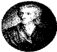
Джов Локк 1632 - 1704 рр.

Гоббс відомий і як один з творців договірної концепції походження держави. На його думку, людина за природою є егоїстичною істотою, і в природному стані відбувається війна всіх проти всіх. Для того щоб уникнути стану постійного розбрату, люди йдуть на укладання договору. Громадянське суспільство, яке утворюється в результаті договору, має істотні переваги перед природним станом міжлюдських стосунків. Головною з них є спроможність передати владу абсолютному суверенові, який забезпечує мир та право на життя. Якщо право на життя не гарантується належним чином, то людська спільнота може і повинна укласти новий договір.