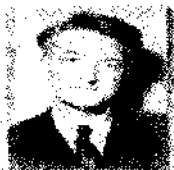
Жак Марітен 1882 - 1973 рр.

філософію історії», «Про церкву Христову». На його думку об'єктом філософії є істина. Діяльність філософа повинна бути незалежною від політичних режимів.