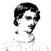
Джордано Бруно 1548 - 1600 рр.

Відомим представником епохи Відродження був Джордано Бруно.