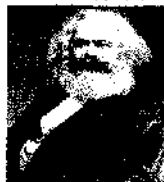
Карл Маркс 1818 - 1883 рр.

Значний внесок у розвиток світової філософської думки зробила марксистська філософія. Вона сформувалась на багатому ґрунті попередніх філософських систем, виникла як складова більш широкого вчення – марксизму. Його творці – Карл Маркс і Фрідріх Енгельс. Основні праці К. Маркса: «Рукописи 1844 року», «Капітал»,