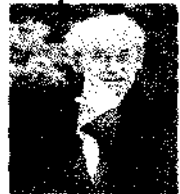
Поль Рікер 1913 - 2005 рр.

Представником релігійної феноменологічної герменевтики є П. Рікер. Його основні твори: «Філософія волі», «Конфлікт інтерпрета-