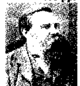
Фрідріх Енгельс 1820 - 1895 рр.

«Німецька ідеологія» (спільно з Ф. Енгельсом). Основні праці Ф. Енгельса: «Анти-Дюрінг», «Діалектика природи», «Походження сім'ї, приватної власності та держави». Згідно з марксизмом, філософів, які визнають матерію первинно, а свідомість вторинною, називають матеріалістами. Тих, хто визнає первинність духу або свідомість, називають ідеалістами. Марксизм став на бік матеріалізму й піддав нищівній критиці не тільки «чистий» ідеалізм, а й будь-які щонайменші відхилення в його бік.