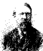
Ернст Мах 1838 - 1916 рр.

До «другого» позитивізму або емпіріокритицизму прийнято відносити близькі за змістом філософські погляди Е. Маха і Р. Авенаріуса. Значення поняття «емпіріокритицизм» – філософія критичного досвіду. У душі суб'єктивного ідеалізму Е. Мах у своїх працях «Аналіз відчуттів і відношення фізичного до психічного»,