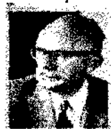
Арнольд Гелен 1904 - 1976 рр.

Розробкою філософської антропології у ХХ ст. займався А. Гелен.