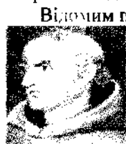
Вільям Оккам 1285 - 1349 рр.

Номіналізм (лат. ім'я) – філософське вчення, що заперечує онтологічне значення універсалій (загальних понять), стверджуючи, що універсалії існують не в дійсності, а тільки в мисленні. Номіналісти вважали, речі одиничні, не приховують ніяких універсалій. Загальні поняття є тільки назвами одиничного, вони – творіння людського розуму.