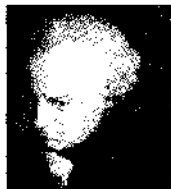
Іммануїл Кант 1724 - 1804 рр.

Засновником німецької класичної філософії є Іммануїл Кант.