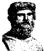
Платон 427-347 рр. до н.е.

Значний вплив на розвиток філософії Давньої Греції здійснив Платон. До відомих праць філософа відносять «Держава», «Федр», «Тімей». Він поділяв суще на світ вічних нерухомих, неділимих,