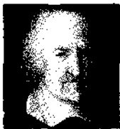
Томас Гоббс 1588 - 1679 рр.

вий досвід людини. Об'єктові чуттєвого сприйняття не притаманні ніякі субстанційні властивості, окрім протяжності. Сприйняття людиною будь-якого матеріального тіла спирається насамперед на показники її органів почуття.