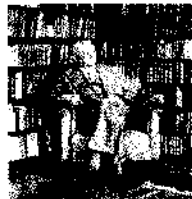
Карл Ясперс 1883 - 1967 рр.

На екзистенціальних традиціях будує своє філософію і К. Ясперс.