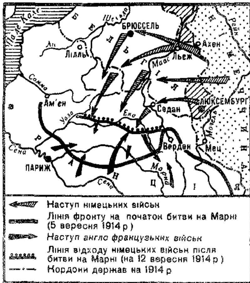
Воєнні дії на Західному фронті в 1914 р

Результатом битви на Марні став остаточний провал "блискавичної війни" — основи плану Шліффена.