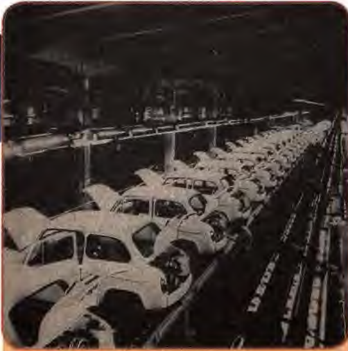
Головний конвеєр складання малолітражних автомобілів. Запоріжжя. 1967 р.

Усе це сприяло забезпеченню високих економічних показників розвитку України. Протягом восьмої п'ятирічки (1966–1970) основні виробничі фонди і загальний обсяг промислового виробництва зросли в 1,5 раза, а національний дохід – на 30 %. Характерно, що дві третини приросту промислової продукції було одержано за рахунок підвищення продуктивності праці.