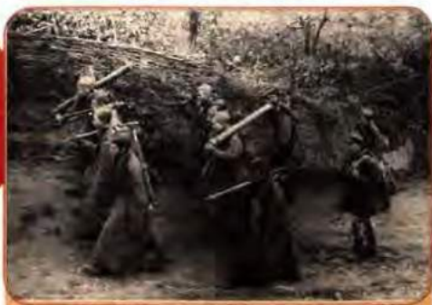
Мінометники 1-го Українського фронту переходять на нову позицію. Букринський плацдарм. 1943 р.

денний фронти відповідно в 1-й, 2-й, 3-й, 4-й Українські фронти.