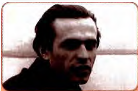
Василь Симоненко – український поет, прозаїк, журналіст, «лицар українського відродження». 1960 рр.

Стрімко увірвалася в українську поезію одна з найобдарованіших представниць «шістдесятників» Ліна Костенко. З відзнакою закінчивши Літературний інститут ім. Горького в Москві, поетеса випускає дві одразу ж помічені критикою збірки поезій – «Проміння землі» та «Мандрівки серця». Ліна Костенко звертається до вічних проблем духовності українського народу, історичного минулого країни. Вірші поетеси вирізняються неординарністю, критичною оцінкою багатьох подій.