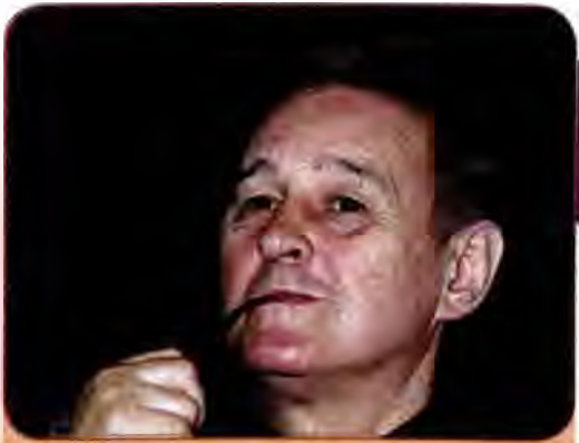
Роман Віктюк – талановитий режисер, відомий своїми епатажними постановками

Різні естетичні напрями доповнюють один одного, створюючи оригінальну, неповторну палітру сучасного українського живопису.