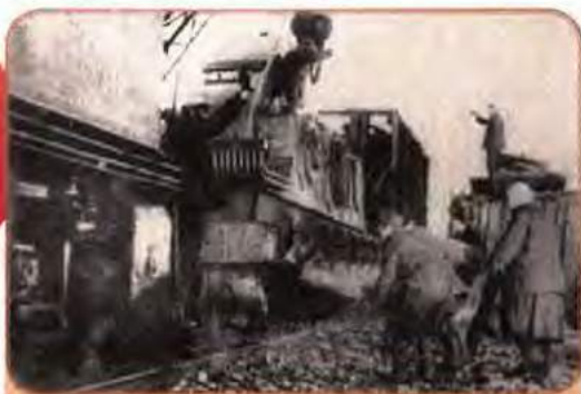
Евакуація заводського обладнання. Запоріжжя. 1941 р.

кладів, державних установ, людей. Раду з евакуації, організовану ЦК ВКП(б) і Раднаркомом СРСР, очолив М. Шверник. В Україні евакуацією керувала комісія на чолі із заступником голови РНК УРСР Д. Жилою. На схід виїхало понад 3,8 млн робітників, селян і службовців. На нових місцях вони включалися в роботу на оборонних підприємствах, у сільському господарстві, в установах.