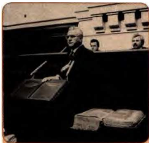
Л. Кравчук складає присягу Президента України на пленарному засіданні Верховної Ради. Київ. 5 грудня 1991 р.

Референдум 1 грудня 1991 р. увійшов в історію України як одна з найсвітліших подій, день національної гідності її народу. На запитання в бюлетені для голосування на всеукраїнському референдумі «Чи підтверджуєте Ви Акт проголошення незалежності України?» 90,32 % виборців відповіли: «Так, підтверджую».