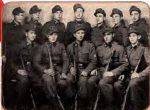
Вояки-українці дивізії СС «Галичина». Львів, 1943 р.

Відмовившись від визнання української державності, гітлерівці разом з тим прагнули використати людські ресурси України як «гарматне м'ясо». У складі Вермахту діяли військові підрозділи, сформовані в окремих країнах Європи. Одним з них була дивізія СС «Галичина», формування якої почалося навесні 1943 р. зусиллями мельниківців за активної участі В. Кубійовича – керівника єдиної легальної української організації на окупованих територіях – Українського центрального комітету. ОУН-Б агітувала проти формування дивізії, закликаючи юнаків поповнювати лави повстанської