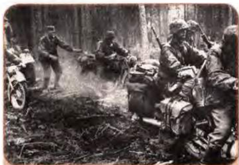
Мотоциклісти Вермахту в лісах Рівненщини. 1941 р.