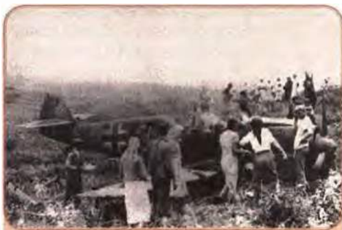
Біля збитого німецького літака. 1941 р.

взули, знищував склади боєприпасів, пального і продовольства, які, відповідно до радянських намірів «воювати на чужій території», були зосереджені в прикордонній смузі. Німецькі війська забезпечили собі значну перевагу.