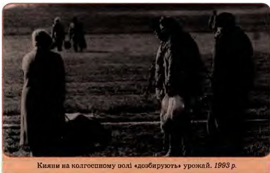
Кияни на колгоспному полі «дозбирають» урожай. 1993 р.

На початку 2000-х років, у зв'язку з економічним оздоровленням, життєвий рівень населення почав зростати, істотно скоротилася заборгованість із заробітної плати. Усі пенсії було повністю виплачено. Доходи населення за даними офіційної статистики в 2001–2005 рр. збільшилися з 158 млрд до 323 млрд грн. Почався споживчий бум: населення почало купувати речі