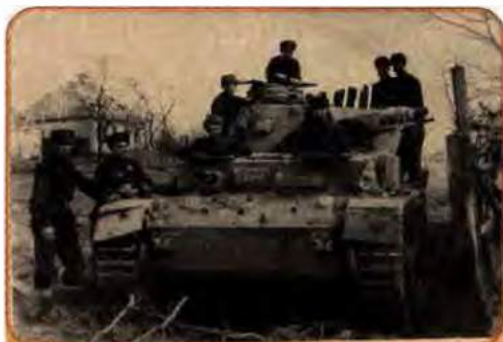
Радянські танкісти перед наступом на м. Харків, 1942 р.

А 19 лютого німецьке командування здійснило контрудар з районів