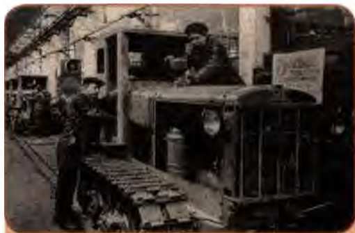
Складання трактора на заводі ім. С. Орджонікідзе. Харків. 1946 р.

Країни, які постраждали у війні, зокрема Німеччина, Японія, держави Західної Європи, відбудову здійснювали в умовах ринкової економіки, приватної власності, конкуренції, співпраці та інтеграції з іншими країнами світу. Нарешті, вони одержали щедрю допомогу США за «планом Маршалла». Нічого цього не було в СРСР. Відмові від ринкових механізмів навіть шукали теоретичне обґрунтування. У брошурі «Економічні проблеми соціалізму в СРСР» Сталін намагався переконати, що товарний обіг гальмує розвиток радянського суспільства. Доводилося, що ефективніше – натуралізація відносин в економіці, перехід до прямого продуктообміну без посередництва грошового еквівалента. Натомість утверджувався планово-командний тиск держави на трудящих, «ножиці» цін на промислову та сільськогосподарську продукцію. Усе диктувалося згори, вимагало безумовного виконання, а той, хто з якихось поважних причин не міг виконати завдання, підлягав осуду, оголошувався саботажником.