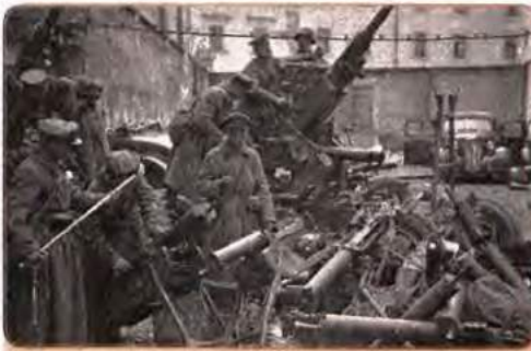
Трофеї, захоплені під час вересневої кампанії Червоної армії на Західній Україні. Львів. Вересень 1939 р.