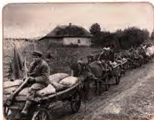
Трудівники колгоспу «Червоний шлях» везуть зерно на приймальний пункт. Чернігівщина. 1940 р.

Весь комплекс адміністративних, економічних і політичних заходів радянського керівництва в 1939–1941 рр. спрямовувався на підготовку до війни. Був створений колосальний воєнно-технічний потенціал. Стояло питання, чи грамотно радянське керівництво скористається ним. Що не все благополучно, продемонструвала радянсько-фінська війна (30 листопада 1939 – 12 березня 1940 р.) . Величезна Червона армія виявилася нездатною розгромити невелику фінську армію. Фінляндія збе-