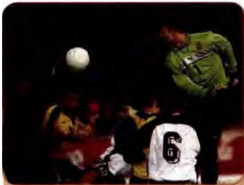
Епізод відбіркового матчу чемпіонату Європи між футбольними збірними командами України та Словенії. Київ. 17 листопада 1999 р.

Перше олімпійське золото для незалежної України завоювала на зимових Олімпійських іграх 1994 р. в Ліллекхаммері Оксана Баюл (фігурне катання). На іграх XXVI літньої Олімпіади 1996 р. спортсмени України, завоювавши 23 нагороди (зокрема 9 золотих), посіли 9-те місце серед 194 країн-учасниць. І хоча цей результат на наступних олімпіадах повторити не вдалося, інформація про досягнення українських атлетів не сходила зі шпальт газет. Спортивну славу України відстоюють кращі боксери-важковики світу брати Віталій і Володимир Клички. Видатні спортивні результати продемонстрували С. Бубка (стрибки з жердиною), О. Зубрилова (біатлон), О. Вітриченко (художня гімнастика), Е. Тедеев (вільна боротьба), І. Разорьонов (важка атлетика), Д. Силантьєв (плавання), С. Голубицький (фехтування на рапірах), О. Жупіна (стрибки у воду), І. Добрянська (легка атлетика), А. Вар-