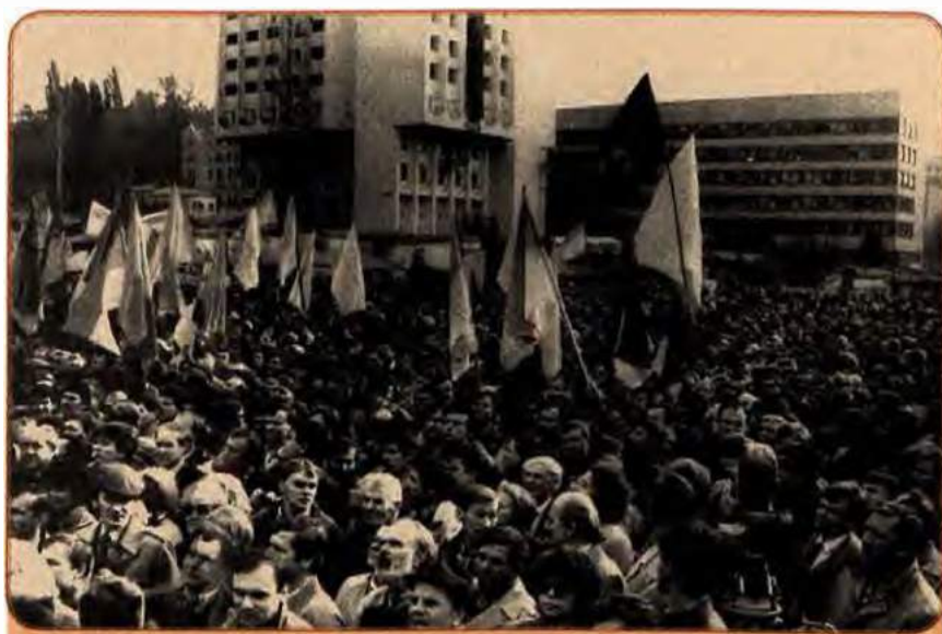
Мітинг «Закону про вибори і закону про мову – демократичну основу». Київ. 1989 р.

1988-й і початок 1989-го років ознаменувалися активізацією політичного життя в країні. Перебудова, яка до цього була справою партійно-державних верхів, викликала рух «знизу», активні дії широких народних мас. Цьому активно сприяла гласність. Союзні, а за ними й республіканські ЗМІ почали публікувати і транслювати інформацію, що раніше була недо-