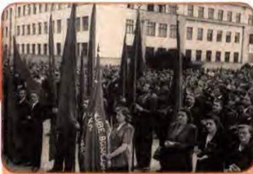
Мітинг з нагоди входження Закарпатської України в єдину УРСР. Ужгород. 8 липня 1945 р.

політичною ситуацією, радянське керівництво взяло курс на приєднання цієї території до складу України. В конкретно-історичній ситуації 1944 р. це відповідало настроям переважної більшості населення краю.