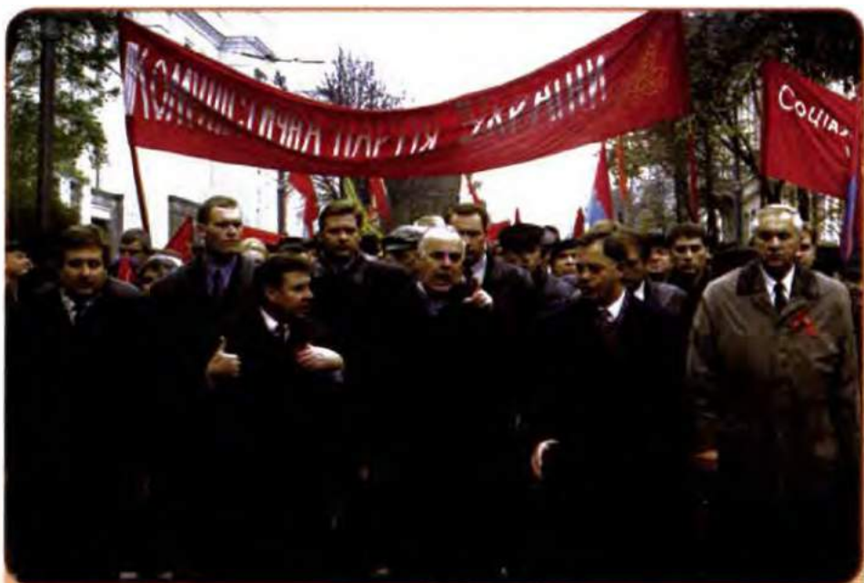
Лідери Компартії України А. Мартинюк, О. Ткаченко та П. Симоненко (другий, третій і четвертий зліва) на чолі колони однопартійців. Київ. 1994 р.

Вибори до Верховної Ради України 1994 р. стали першими в новітній історії виборами, які відбувалися в умовах багатопартійності. Через недосконалість виборчого законодавства 27 березня із 450 депутатів (повний склад депутатського корпусу) було обрано лише 338. З них 28 % представляли Компартію