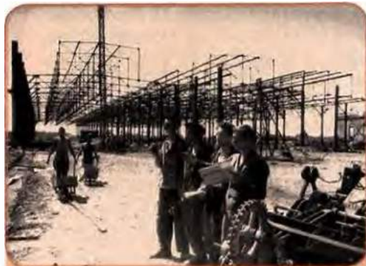
На побудові головного цеху Львівського автобусного заводу. 1948 р.

У 1949 р. в західних областях України діяло 2500 великих і середніх промислових підприємств. Кількість