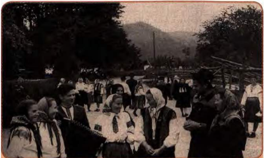
Молодь с. Космач на Станіславщині (сучасна Івано-Франківська обл.) у години дозвілля. 1959 р.

Після вересневого (1953) пленуму ЦК КПРС помітні зрушення відбулися в оплаті праці колгоспників. Замість оплати один раз на рік було введено помісячне, подекуди – поквартальне грошове та натуральне авансування. Видача продукції на трудодні стабілізувалася, а грошова оплата зросла більш ніж у чотири рази. У 1956 р. на 80 % було збільшено розміри пенсій, хоча колгоспни-