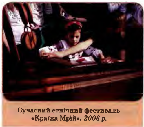
Сучасний етнічний фестиваль «Країна Мрій». 2008 р.

В останні роки, попри скрутне економічне становище, в багатьох колективах фізкультури, спортивних клубах зусиллями адміністрації, профспілкових і фізкультурних організацій почали систематично проводити масові змагання, оздоровчі заходи.