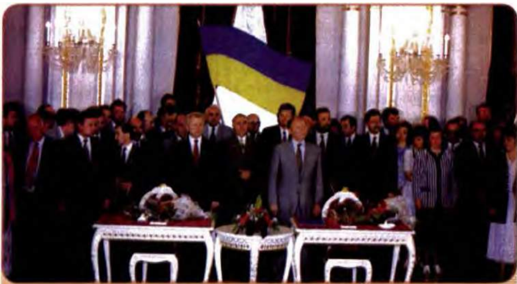
Прийняття Конституції України. Київ, 1996 р.

Паралельно продовжувалася робота над Конституцією, до якої були залучені найкращі фахівці. 11 березня 1996 р. співголови Конституційної комісії – Президент України та Голова Верховної Ради України – підписали проєкт Конституції. Цей проєкт Л. Кучма запропонував парламенту прийняти за основу. Але ця пропозиція не пройшла: Верховна Рада направила його на вивчення до постійних комісій парламенту. Це означало, що прийняття нової Конституції знову відкладається на невизначений термін.