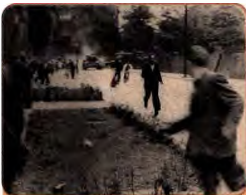
Польські страйкарі втікають від радянського танка. Познань. 1956 р.

Не допускаючи виходу жодної країни з так званого соцтабору, Радянський Союз у той же час прагнув роз-