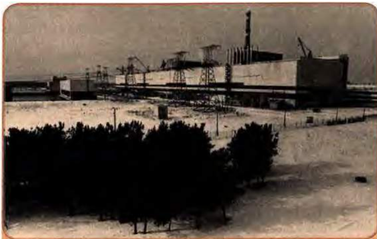
ЧАЕС. Загальний вигляд до 26 квітня 1986 р.

брали участь в ліквідації катастрофи (ліквідатори), стали інвалідами, 7 тис. померли. В районі катастрофи з'явилася 30-кілометрова «зона відчуження», звідки жителів було переселено в інші регіони республіки. Лише прямі втрати України, яка мусила майже повністю взяти на себе справу ліквідації катастрофи на електростанції, що підпорядковувалася свого часу союзному відомству, становили в 1988–1990 рр. у тодішньому масштабі цін понад 20 млрд крб. Та це не вирішило проблеми, і ще довго Україна змушена буде виділяти мільярди на ліквідацію наслідків Чорнобиля, захист тих, хто від нього постраждав.