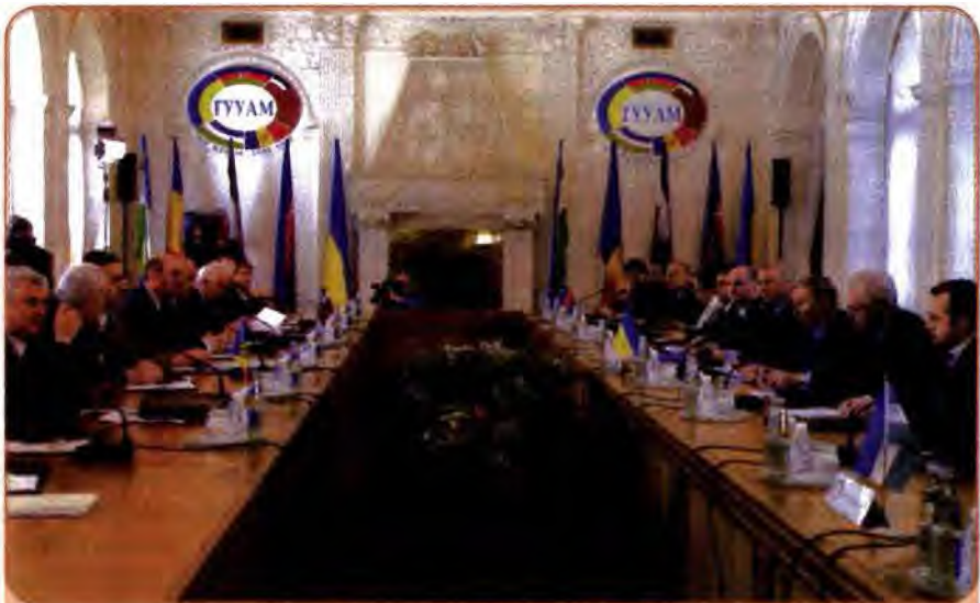
Пленарне засідання глав держав-учасниць ГУУАМ. Ялта, 7 червня 2001 р.

Саме в цьому контексті керівництво України розглядає ідею створення Єдиного економічного простору (ЄЕП) – економічної, а можливо, й політичної інтеграції держав СНД. Про намір створення ЄЕП президенти Росії, Казахстану, Білорусі та України заявили ще 2003 року. Однак коли справа