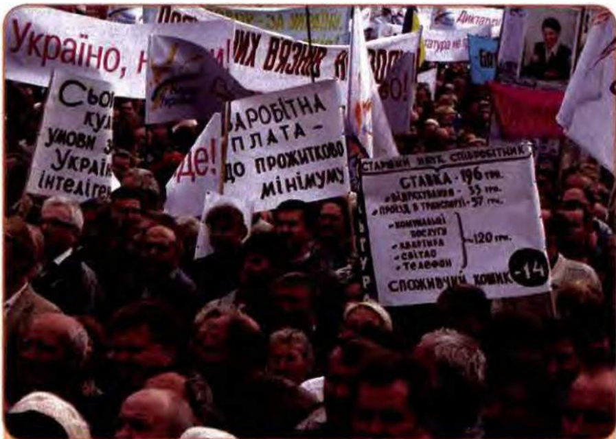
На мітингу «Повстань, Україно!» на Європейській площі в Києві. 2002 р.

Як відомо, з пропозиціями утвердити в Україні парламентсько-президентську (чи навіть парламентську) модель постійно виступали ліві партії. Але в конкретній ситуації літа 2003 р. вони зустріли проект Президента в багнеті: більшості у них у Верховній Раді вже не було, а відтак не було і надій на проведення в новому форматі влади своєї політичної лінії. До того ж після «касетного скандалу» довіра до Л. Кучми була повністю втрачена. Владу звинувачували в неефективній економічній політиці, яка призводить до зuboжіння мас, масштабній корупції, кричущому порушенні свободи слова, заангажованості судової системи. Було ще одне серйозне обвинувачення: Л. Кучма не вірить у перемогу на майбутніх виборах провладного кандидата і хоче залишити своєму наступнику, яким буде представник опозиції, мінімум повноважень.