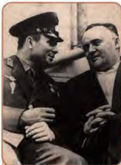
Ю. Гагарін та С. Корольов. Москва. 1961 р.

науково-технічна революція (НТР), що супроводжувалася широким впровадженням у виробництво розробок нової техніки, інтенсифікацією виробничих процесів, механізацією і автоматизацією трудомістких робіт. НТР дала життя новим галузям промисловості, пов'язаним з виробництвом автоматичних і телемеханічних пристроїв, електронно-обчислювальних машин, штучних матеріалів, розвитком атомної енергетики тощо. Традиційні галузі індустрії – класична металургія, видобуток вугілля, важке машинобудування – вже не визначали рівень економічної могутності держави. Проте ці галузі були найрозвиненішими в Україні. Саме тому на перший план вийшли питання модернізації, структурної перебудови промисловості УРСР.