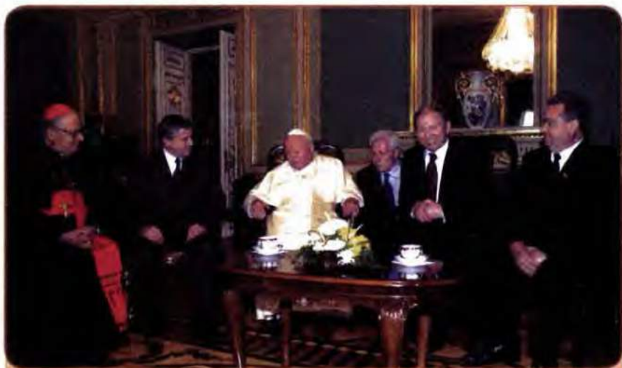
Зустріч Президента України Л. Кучми та інших офіційних осіб з Папою Римським Іоанном Павлом II. Київ, Червень 2001 р.

між Ватиканом і Москвою та лібералізацію релігійного життя в СРСР, радянський уряд та, особливо, Московський патріархат всіляко перешкоджали відродженню УГКЦ. Лише в грудні 1989 р., після зустрічі М. Горбачова з Іоанном Павлом II та численних багатолюдних демонстрацій непокори, в західних областях України намітилися певні зрушення в напрямі легалізації Української греко-католицької церкви. У квітні 1990 р. на вимогу УГКЦ Львівська міська рада передала католикам собор Святого Юра. Визнаним лідером церкви виступив єпископ Мирослав-Іван кардинал Любачівський.