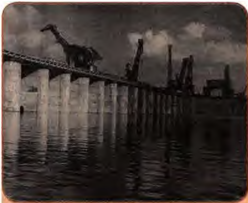
Гребля Каховської ГЕС, Херсонщина. 1955 р.