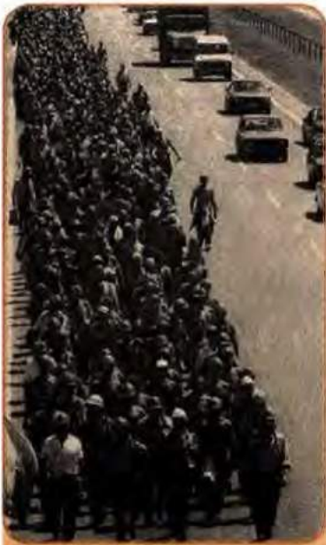
Колона шахтарів прямує на Київ, 1990 р.

передбачалося застосовувати надзвичайно серйозні санкції – штрафи, втручання прокуратури. Але цей указ не виконувався, і 14 грудня 1990 р. Президент змушений був підписати новий указ, у якому йшлося про необхідність виконання попереднього.