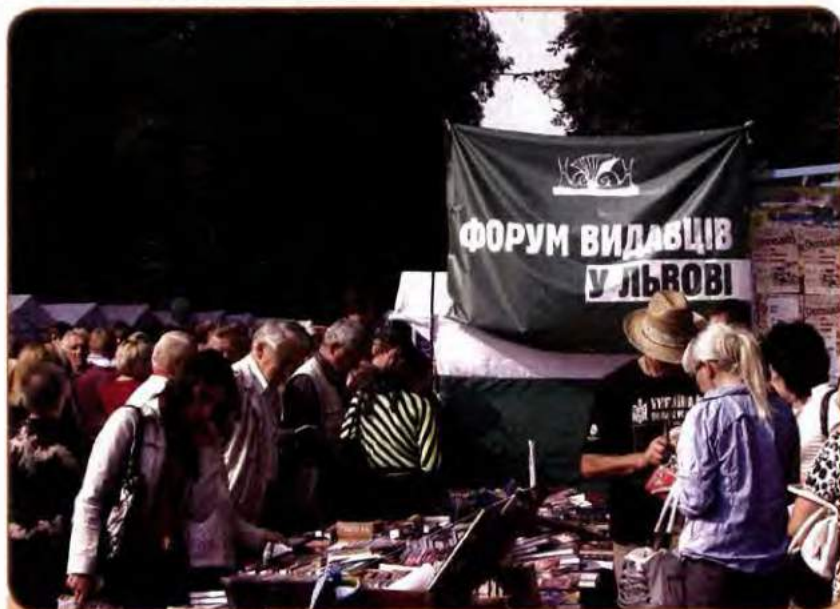
«Форум видавців» – книжковий ярмарок, який щорічно проводиться у Львові