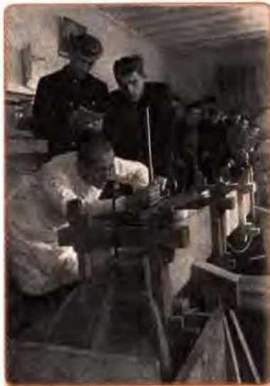
Студенти гідротехнічного інституту в лабораторії. Одеса. 1951 р.

ліну, оголошувалося найвищим, найважливішим покликанням школи.