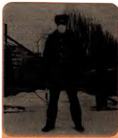
Міліцейський пост перед в'їздом у Чорнобиль. 1986 р.

Усім було відомо, що впродовж десятиліть наступ загальносоюзних чиновників на українську культуру відбувався за сприяння тієї ж Компартії України, яка за будь-яку ціну прагнула продемонструвати центрові свій