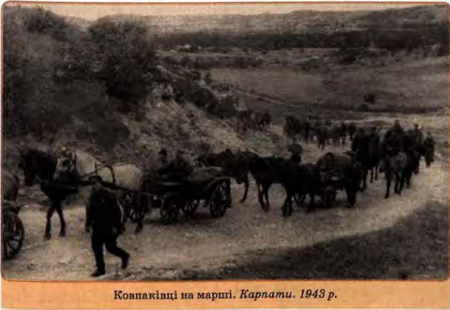
Ковпаківці на марші. Карпати. 1943 р.

армія одержала 1260 агентурних донесень. Боротьба радянських партизанів і підпільників у тилу німецьких військ була важливим фактором, що забезпечував успішне просування Червоної армії. За підрахунками сучасних істориків, загальна кількість осіб, які перебували у різні роки війни в партизанах і підпіллі в Україні, становила приблизно 180–220 тис. осіб. 29 учасників радянського підпілля і партизанського руху відзначені званням Героя Радянського Союзу.