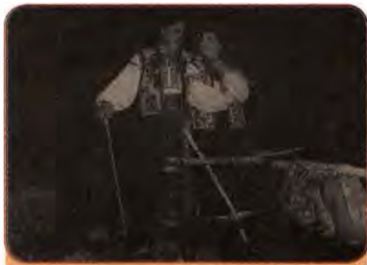
Сцена з опери Г. Майбороди «Мілана» в постановці Київського театру опери та балету ім. Т. Шевченка. 1951 р.

Таким чином, українська культура скористалася новими можливостями, які виникли в умовах деєталінізації суспільства. Але вийти за рамки, поставлені для неї партійно-радянським керівництвом СРСР, вона була неспроможна.