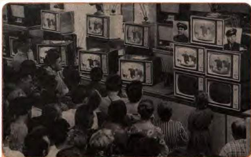
У крамниці радіотоварів. Київ. 1962 р.

талися в ательє або шили дома за лекалами. Кому «пощастило» і в кого були кошти, у перекупщиків («спекулянтів») купували іноземне. У моду стала входити косметика. Промисловість поступово налагоджувала масовий випуск нейлонових сорочок, капронових панчіх і шкарпеток із синтетики. Щоправда, аби їх придбати, необхідно було кілька годин простояти в черзі.