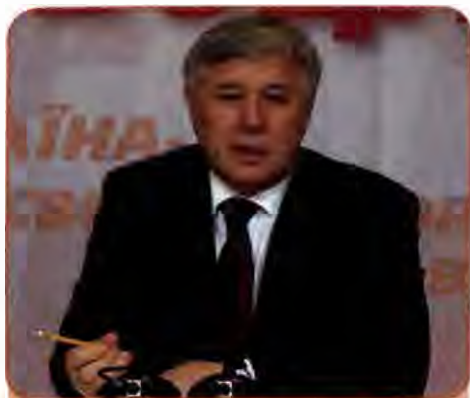
Юрій Єхануров – Прем'єр-міністр України. Вересень 2005 – серпень 2006 р.

Після підрахунку голосів між БЮТ, «Нашою Україною» і Соцпартією було укладено угоду про створення в новому парламенті демократичної коаліції. На звичний для себе пост Голови Верховної Ради претендував О. Мороз – лідер найменшої в коаліції Соціалістичної партії. Ю. Тимошенко заявила, що вважає цілком обґрунтованим для себе претендувати на пост Прем'єр-міністра в коаліційному уряді. Почалися тривалі та виснажливі переговори, в ході яких з'явилися нові претенденти на ці посади з табору