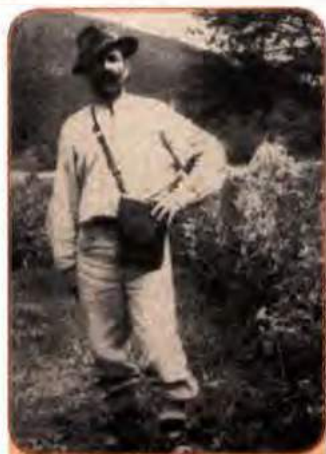
Гуцул. Станіславська (сучасна Івано-Франківська) обл. 1946 р.

У 1946 р. з 16 129 номенклатурних посад у західних областях України місцеві жителі обіймали лише 2097, тобто 13 %. Більшовицький центр їм не довіряв і керував краєм з допомогою вимуштруваних на сході, але чужих місцевому населенню кадрів. По суті це була колоніальна адміністрація.