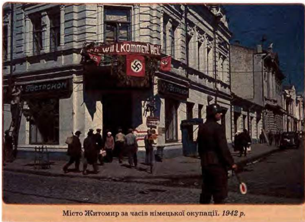
Місто Житомир за часів німецької окупації. 1942 р.

Гітлерівський план «Ост» передбачав перетворення України на колоніальну країну, аграрно-сировинний придаток рейху, «життєвий простір» для колонізації представниками «вищої раси». Місцеве населення, у тому числі українці, росіяни та інші, підлягали витісненню і навіть фізичному винищенню. Сотні тисяч жителів великих міст України стали жертвами організованого окупантами голоду. Протягом 103 тижнів окупації кожного вівторка і п'ятниці в Бабиному Яру в Києві розстрілювали людей різних національностей, переважно євреїв. Масове винищення євреїв увійшло в історію під назвою «холокост» («всеспалення»). Свій «Бабин Яр» був у кожному великому місті України. Усього в перші місяці окупації України жертвами нацистів стали 850 тисяч євреїв. В окупації вижило мало. Частина з них своїм життям завдячує місцевому населенню – «праведникам миру» .