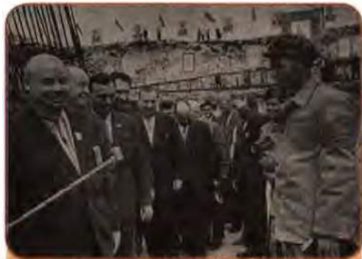
Урочисте закладення першого бетону на будівництві Трипільської ДРЕС. Перший ліворуч – П. Шелест. Київщина. 1964 р.

Широкий попит населення на товари повсякденного вжитку і побутові послуги, який держава виявилася неспроможною задовольнити, породив