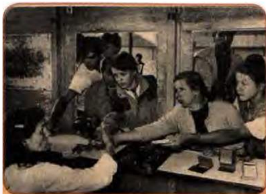
У черзі за хлібом перед підвищенням цін. Луганськ. 1992 р.

Одним з майже легальних способів цього було утворення при державних підприємствах великої кількості комерційних малих підприємств (МП). Саме під їх прикриттям розкрадалася народна власність, а гроші перекачувалися за кордон. Так, у 1992 р. Росія згідно з укладеним договором поставила в Україну 32 млн т нафти. Її ціна була в 10 разів нижча за світову. Протягом короткого часу 8 млн т цієї нафти було продано за допомогою МП за кордон. Гроші осіли на приватних рахунках іноземних банків. Україна