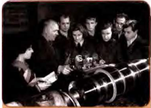
Токар турбінного заводу ім. С. Кірова зі студентами Московського енергетичного інституту. Харків. 1956 р.

Далекосяжні задуми керівництва КПРС реалізувалися в умовах, коли бюджетні асигнування на найнеобхідніше – освіту, науку, культмасову роботу, не кажучи вже про театр, живопис, кіно та інші види мистецтва – в Україні в розрахунку на душу населення були нижчими, ніж у Росії і деяких інших республіках СРСР, зокрема в Прибалтиці. «Залишковий принцип» забезпечення соціально-культурної сфери, характерний для СРСР у цілому, особливо гостро і пекуче відчувався в Україні.