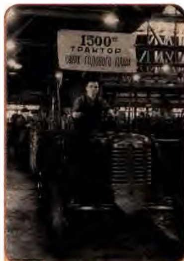
1500-й понадплановий трактор. Харків. 1955 р.

У СРСР формувалася військово-промисловий комплекс (ВПК) – підприємства, науково-дослідницькі центри, конструкторські бюро тощо, спрямовані на випуск продукції військового призначення найвищої якості. Багато таких підприємств і дослідницько-конструкторських закладів працювали в Україні.