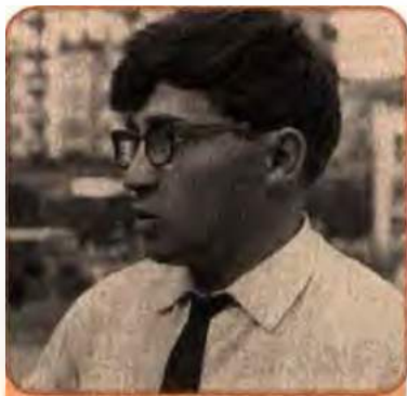
Євген Гуцало – український прозаїк. 1960 рр.

У 60-х роках ім'я київського письменника В. Некрасова тісно пов'язувалося з найбільш опозиційно-демократичним журналом «Новый мир», головним редактором якого був О. Твардовський.