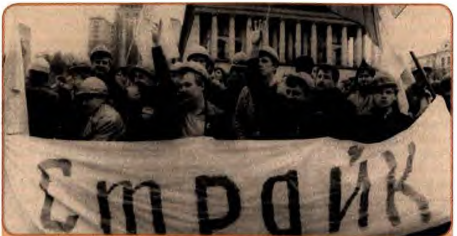
Політичні пристрасі на вулицях та майданах. Київ, 1990 р.

Здобувши перші перемоги, опозиція продовжувала тиск на владу. Це продемонстрували II Всеукраїнські збори Народного руху України, які відбулися з 25 по 28 жовтня 1990 р. у Києві. Збори внесли зміни до статуту і програми цієї громадсько-політичної організації. З її назви були вилучені слова «за перебудову». Нова стратегія накреслювала шляхи боротьби за досягнення незалежності. Це був повний розрив з лінією Компартії України. Налякана радикалізацією громадського руху в Україні і постановою Верховної Ради щодо вимог студентів Компартія республіки готувалась до контрнаступу. Спираючись на депутатську більшість у Верховній Раді, ско-