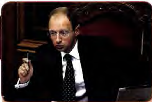
Арсеній Яценюк – Голова Верховної Ради України. Грудень 2007 – листопад 2008 р.

Президента. Врешті, політичні опоненти скористалися ситуацією: після залаштункових переговорів була досягнута домовленість про створення так званої антикризової коаліції, яка включала Партію Регіонів, соціалістів і комуністів. На посаду Голови Верховної Ради було проведено О. Мороза, а Прем'єр-міністром став В. Янукович. БЮТ і «Наша Україна» стали в опозицію до парламентської більшості й уряду В. Януковича.