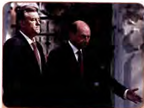
Президент Румунії Траян Басеску вітає Президента України Віктора Ющенка у Бухаресті. 30 жовтня 2007 р.

У контексті підписання українсько-румунського договору 2 червня 1997 р. вирішувалася і доля острова Зміїний на Чорному морі, розташованого за 35