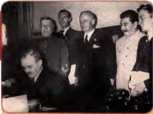
Й. Сталін, Й. Ріббентроп (стоять другий і третій праворуч) і В. Молотов (сидить) під час підписання Договору про ненапад між Німеччиною та Радянським Союзом. Москва. 1939 р.

ної лінії сталінського керівництва СРСР. Жодного впливу не мала вона й на зміну зовнішньополітичного курсу радянського керівництва, яке після багатьох років антифашистської пропаганди раптом наприкінці серпня 1939 р. несподівано пішло на зближення з Німеччиною.