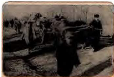
Мешканці м. Каховка на Херсонщині повертаються в рідні домівки. 1943 р.

Увесь жовтень радянське командування концентрувало війська на правому березі Дніпра, готуючись до продовження наступу. Прагнучи підкреслити виняткову важливість цих операцій і піднести бойовий дух військ, які з виходом в Україну поповнювалися здебільшого за рахунок місцевих жителів, Ставка перейменувала 20 жовтня 1943 р. Воронезький, Степовий, Південно-Західний і Пів-