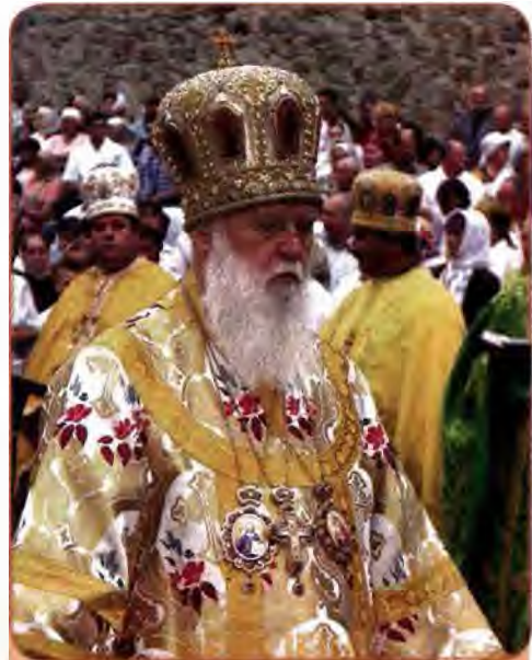
Філарет (Денисенко) – патріарх УПЦ Київського патріархату

При Президенті В. Януковичу влада чітко визначила свою орієнтацію на УПЦ, підпорядковану Московському патріархату.