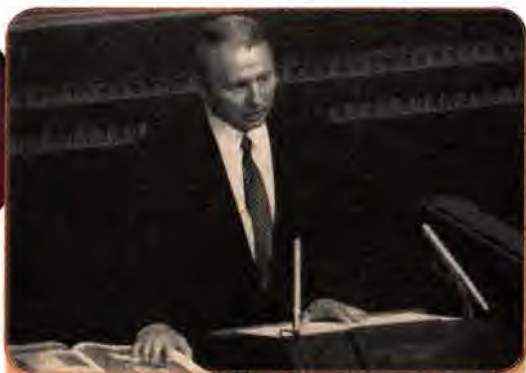
Новообраний Президент України Л. Кучма складає присягу на вірність народові України. Київ. 19 липня 1994 р.

ському народові. Поклавши праву руку на видатну пам'ятку української духовності XVI ст. – Пересопницьке євангеліє, глава держави присягнув дотримуватися Конституції та Законів України, поважати права і свободи людини, захищати суверенітет України, добросовісно виконувати покладені на нього обов'язки.