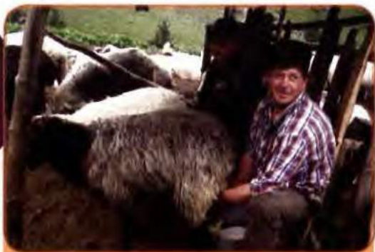
Відродження давньої галузі сільського господарства – вівчарства. Закарпаття

що було звичайним явищем у колгоспах та радгоспах. Факти свідчать, що, використовуючи у 1994 р. лише 1,6 % площі земельних угідь, фермерські господарства виробляли стільки, скільки виробляла середня область України. Водночас поширеним явищем стало отримання землі для заняття фермерством керівниками господарств та наближеними до них особами. Разом із кращими угіддями вони на вигідних умовах скуповували колгоспну та радгоспну техніку.