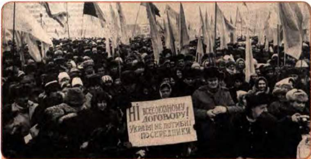
Демонстрація проти підписання керівництвом УРСР нового союзного договору. Київ, 1990 р.

їни. Він суттєво обмежував права республіки та знову передбачав формування союзних органів влади з великими повноваженнями у сфері міжнародних зносин, фінансової політики, передбачав повернення до норми щодо верховенства союзних законів над республіканськими.