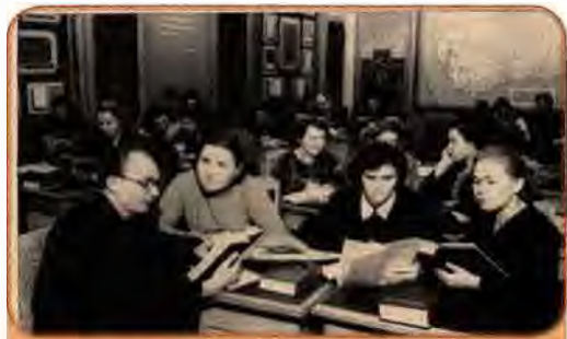
Студенти Одеського державного університету ім. І. Мечнікова готуються до сесії. 6 травня 1955 р.

Колектив Науково-дослідного конструкторсько-технологічного інсти-