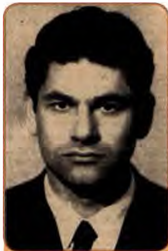
Йосип Тереля - поборник прав української греко-католицької церкви. 1970 рр.

Після 1980 р. арешти тривали. Було заарештовано за звинуваченням в антирадянській