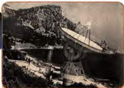
Радіотелескоп Кримської астрофізичної обсерваторії АН СРСР. 1978 р.

виток її найважливіших напрямів. XXIV з'їздом КПРС у 1971 р. було поставлене завдання – «органічно з'єднати досягнення науково-технічної революції з перевагами соціалізму». Але радянському режимові виявилось не під силу належним чином скористатися досягненнями НТР. Відсутність інтелектуальної свободи гальмувала прогрес радянської науки. Згубний вплив на неї справляла також штучна ізоляція вчених СРСР від світового наукового співтовариства.