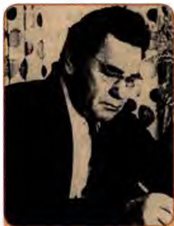
Микола Руденко – український дисидент, керівник УГГ, поет і прозаїк

У декларації проголошувалося, що в своїй роботі Група керується не політичними, а лише гуманітарно-правовими мотивами і своєю головною