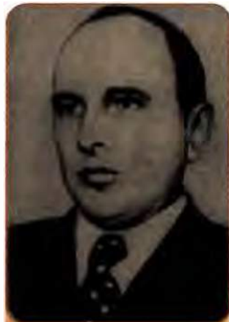
Степан Бандера – провідник ОУН і УПА

Перші дні війни засвідчили безпідставність надій на досягнення бодай обмеженої незалежності з допомогою Німеччини. Ввечері 30 червня, одразу ж після відступу радянських військ зі