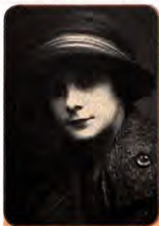
Олена Теліга – видатна українська поетеса, політичний діяч

художники, актори, котрі опинились у гітлерівському тилу, боролися проти окупантів як у складі партизанських з'єднань, підпорядкованих Москві, так і в загонах УПА. В окупованому гітлерівцями Києві група письменників, членів ОУН, на чолі з Оленою Телігою зорганізувалася в Спілку українських письменників. О. Теліга готувала альманах української поезії «Литаври». Разом з іншими членами оунівського підпілля її розстріляли 21 лютого 1942 р. у Бабиному Яру.