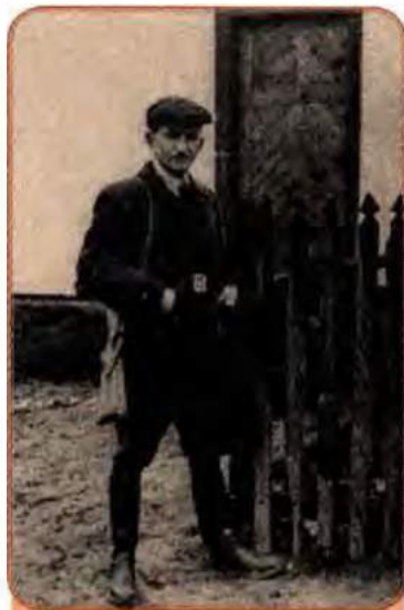
Головний командир УПА Роман Шухевич. Друга половина 1940-х рр.

Однак і на цьому боротьба не закінчилася. Окремі оунівські групи були викриті лише в 60-ті роки. Таке тривале існування було неможливе без певної підтримки населення. Це свідчить, що радянізація західних областей України відбувалася досить повільно. Було чимало випадків, коли ідеями незалежності України, які пропагували повстанці і підпільники, переймалися вихідці з Наддніпрянщини, які з тих чи інших причин опинялися в Західній Україні: вчителі, медпрацівники, червоноармійці (навіть офіцери), селяни (що під час голоду 1946–1947 рр. масово приїжджали до Галичини).