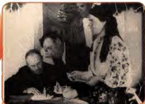
Трудівники колгоспу ім. М. Щорса на Київщині підписуються на державну позику. 1948 р.

Одним із джерел фінансування відбудови були державні позики у населення, які проводилися щорічно фактично у примусовому порядку.