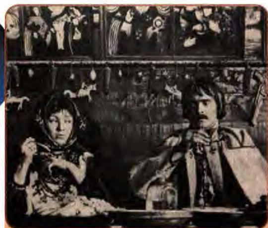
Іван Миколайчук і Тетяна Вєстаєва в кінофільмі С. Параджанова «Тіні забутих предків». 1964 р.

У 1980–1982 рр., вперше за довгі роки Державний академічний оперний театр України брав участь у знаменитому Вісбаденському фестивалі. Світ полонили елементи «незнайомої козацької екзотики», високий рівень акторського виконання майстрів сцени в опері «Тарас Бульба» М. Лисенка.