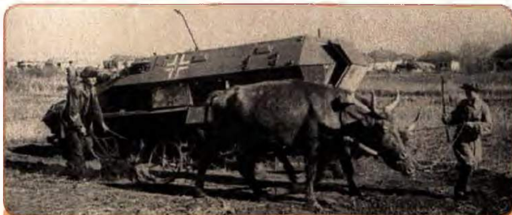
Селянин оре землю в одному із сіл на Ворошиловградщині (сучасна Луганська обл.). 1943 р.

Всього до травня 1945 р. було відбудовано і введено в дію близько 3 тис. великих промислових підприємств України. Промисловий потенціал України працював на забезпечення фронту боєприпасами, бойовою технікою, спорядженням.