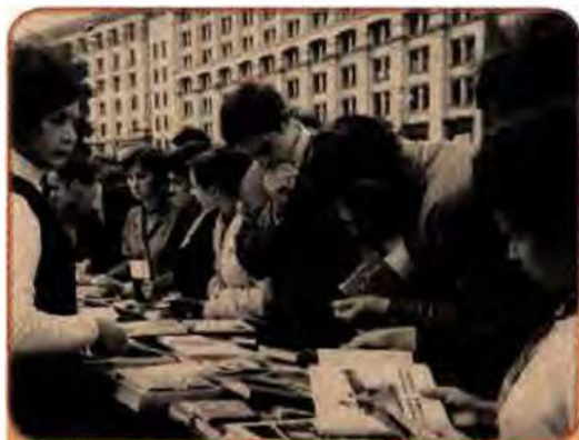
Продаж книжок на Хрещатику у Києві. 1970 р.

У системі культосвітньої роботи значне місце посідали бібліотеки, яких на середину 1980-х років налі-