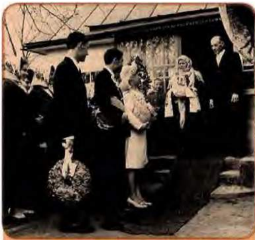
Батьки зустрічають молодих. Село Чернятка Бершадського району на Вінничині. 1971 р.

Невтішні демографічні зміни відбувалися і в місті, де також зменшувалася народжуваність. Збільшувалася частка малих сімей – без дітей і з однією дитиною: у цілому по Україні в 1960 р. їх було 55,5%, у 1989 р. – 62,0%. Побутова невлаштованість – мільйони молодих людей жили в гуртожитках – заважала створювати сім'ї. Було багато розлучень. Збільшувалася кількість