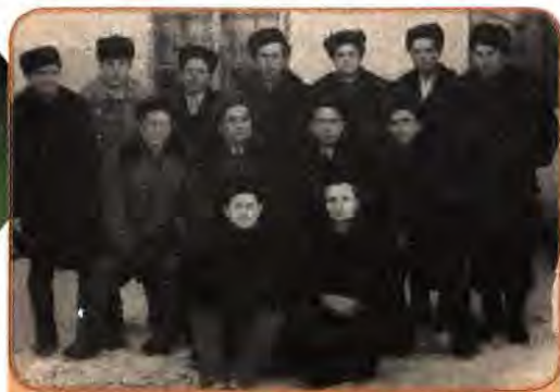
Спецпоселення із Західної України в с. Котівівка. Іркутська обл. (нині РФ). 1956 р.

То вже був третій етап реабілітації (перший – 1953 р., другий – 1954–1955 рр.). Змінився й порядок проведення цієї акції. За пропозицією М. Хрущова було створено 90 спеціальних комісій, що мали право розглядати справи безпосередньо в таборах ув'язнення. До їхнього складу входили працівники прокуратури, представники апарату ЦК КПРС і вже реабілітовані члени партії. Комісіям тимчасово надавалися права Президії Верховної Ради в справі реабілітації, помилування, зменшення терміну ув'язнення, перегляду статей звинувачення.