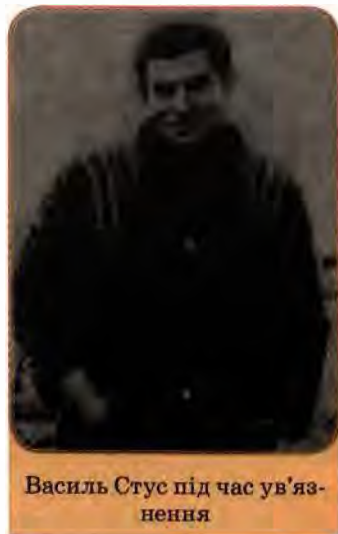
Василь Стус під час ув'язнення

Частині письменників-«шістдесятників» у 70–80-х роках вдалося уникнути репресій. До числа їхніх здобутків можна віднести вірші Івана Драча з книжки «Корінь і крона», ліричну збірку «На срібному березі» Миколи Вінграновського, «Розп'яття» Петра Скунця, «Таємницю твого обличчя» Дмитра Павличка, «Перевтілення» Віталія Коротича.