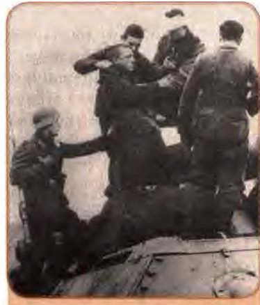
Німецькі солдати й полонені червоноармійці на підбитому танку. 1941 р.

Київ. Війська фронту розбилися на численні загони й групи, кожна з яких самостійно виривалася з оточення. Тисячі солдатів та командирів загинули, переважна більшість особового складу фронту – понад 665 тис. – потрапила до німецького полону. Доля фронту спіткала і його командування. Штабна колона була оточена фашистськими військами біля урочища Шумейки на Полтавщині. У бою загинули командувач Південно-Західного фронту генерал-полковник М. Кирпонос, член Військової ради М. Бурмистенко, начальник штабу фронту генерал В. Тупіков і сотні командирів військ фронту. Трагедія Південно-Західного фронту була однією з найбільших невдач Червоної армії у 1941 р.