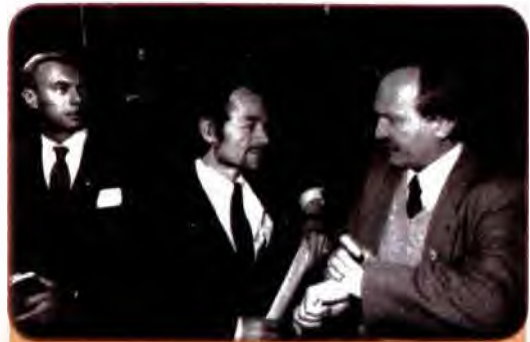
Народний депутат України Вячеслав Чорновіл і Голова Меджлісу кримськотатарського народу Мустафа Джемільєв. Сімферополь, 1992 р.

Однак це не заспокоїло сепаратистів. У січні 1993 р. на виборах президента АРК їм вдалося привести до перемоги лідера Республіканської партії Криму Ю. Мешкова. Останній, незважаючи на зваженість та толерантність політики Києва щодо Криму, одразу ж узяв курс на рішучу конфронтацію. З грубим порушенням чинного загальноукраїнського законодавства було прийнято у травні 1994 р.