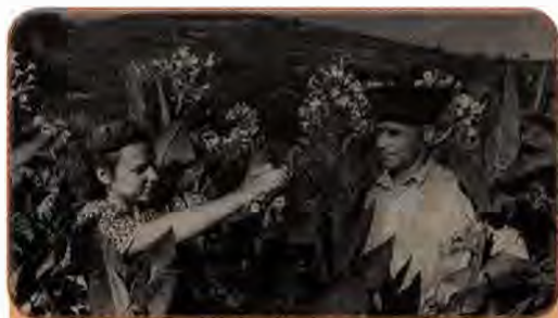
Тютюнова плантація колгоспу ім. С. Кірова на Закарпатті. 1954 р.

Та найбільші земельні площі планувалося освоїти в Казахстані. На заклик уряду з України потяглися ешелони з випускниками профтехучилищ, робітничою молоддю. Усе це здійснювалося організовано: підприємства, звідки від'їжджала молодь, споряджали її всім необхідним. Про освоєння