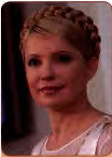
Юлія Тимошенко – Прем'єр-міністр України. 2005 р., грудень 2007 – березень 2010 р.

Взагалі політика Ю. Тимошенко була спрямована на обмеження крупного бізнесу, контроль над цінами, спроби переглянути наслідки приватизації часів президентства Л. Кучми. Наводилися різні дані про кількість підприємств, які планувалося повернути державі, а згодом перепродати, – від 30 до 3000. Частині суспільства це сподобалося, але приватний капітал і зарубіжні інвестори були в паніці. Ділитися з бідними багаті в такий спосіб відмовлялися. Замість економічних важелів впливу на економічну ситуацію Прем'єр-міністр схилилася до управління в ручному режимі. Ділова активність згортала. Це негативно позначилося на економічних показниках. Наприкінці літа 2005 р. стосунки Прем'єр-міністра і Президента, в якого були інші, суто ліберальні погляди на економічну політику, загострилися.