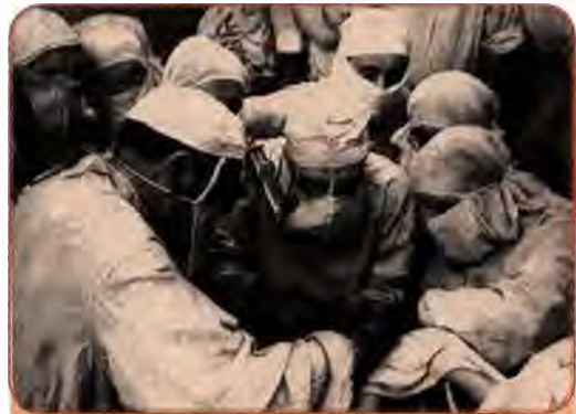
Видатний український хірург В. Філатов під час операції. Одеса. 1946 р.

У роки війни влада була зацікавлена в ефективній роботі наукових установ і окремих учених. Поступово йшло відродження вільнодумства в науці, без чого вона приречена на відставання. Після перемоги творча атмосфера почала розвіюватися. Система керівництва наукою створювала умови для засилля авантюристів. Унаслідок цього деякі перспективні напрями наукових досліджень, зокрема генетику, було оголошено ідеалістичними, «лженауковими». Представників цієї науки, які проводили досліди на мухах-дрозофілах, називали «Мухолобами-людиноненависниками». Так, на серпневій (1948) сесії Всесоюзної академії сільськогосподарських наук ім. Леніна (ВАСГНІЛ), підтриманий верхами, у тому числі й Сталіним, невіглас і шахрай Т. Лисенко після тривалої боротьби, розпочатої ще в 30-ті роки, здобув остаточну перемогу над своїми науковими опонентами-генетиками. Почалися переслідування й розправи, жертвами яких стали також учені, що працювали в Україні. У Харкові було звільнено з роботи завідуючого кафедрою генетики і дарвінізму Харківського університету професора І. Полякова і професора сільськогосподарського інституту Л. Делоне. Така сама доля спіткала багатьох учених і в інших наукових центрах республіки. Розгром генетики став однією з ганебних сторінок в історії