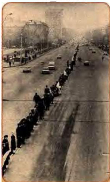
«Живий ланцюг» між Києвом та Львовом, що символізував злуку Західної і Східної України. 22 січня 1990 р.

Місцеві організації Компартії України опинилися в цих областях у незвичній для себе ролі опозиційних. Над багатьма містами й селами України замайорили блакитно-жовті національні прапори.