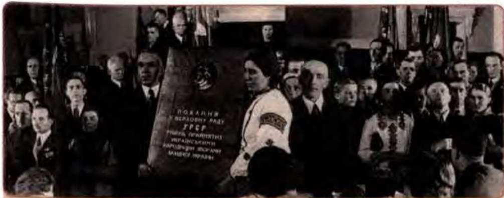
Делегація Західної України на III позачерговій сесії Верховної Ради УРСР. Київ, 1939 р.

Вводилося безкоштовне медичне обслуговування. Це особливо імпонувало сільському населенню, яке здебільшого взагалі не знало, що таке стаціонарна медична допомога. Симпатії до нової влади збереглися навіть попри її наміри здійснити докорінну ломку старих, заснованих на приватній власності й ринкових відносинах, економічних структур. Річ у тому, що спершу перетворення в економіці мало торкалися інтересів українського населення, бо промисловість, торгівля та велике землеволодіння перебували в основному