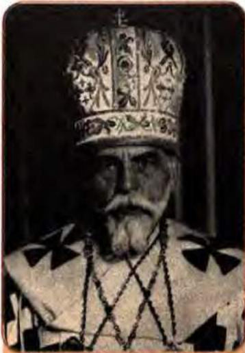
Йосип Сліпий – митрополит греко-католицької церкви в Галичині, який відмовився перейти в російське православ'я

оунівцям. На жорстокість чекістів ОУН відповідала терором, широко використовуючи методи НКВС. Підрозділи Служби безпеки (СБ) УПА, зі свого боку, засиляли псевдоєнкаведистів для виявлення прибічників радянської влади і законспірованих чекістів. Усе це тільки розпалювало взаємну ворожнечу, ненависть, непримиренність у суспільстві.