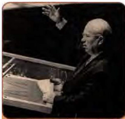
Микита Хрущов виступає на сесії Генеральної Асамблеї ООН. Нью-Йорк. 1 жовтня 1960 р.

Проявом цього стала фактична заборона для вітчизняного читача (аж до 1989 р.) самого тексту доповіді М. Хрущова на ХХ з'їзді. Громадянам СРСР запропонували її «полегшену» версію: у липні 1956 р. було опубліковано постанову ЦК КПРС «Про подолання культу особи та його наслідків». За змістом і гостротою викладу цей документ став кроком назад порівняно з доповіддю. Та й сам М. Хрущов поступово почав змінювати тональність виступів. У ряді промов він говорив, що Сталін – це «великий революціонер», «великий марксист-ленінець», і партія не дозволить «віддати ім'я Сталіна ворогам комунізму».