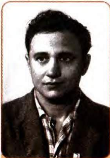
Валерій Шевчук – український письменник-«шістдесятник», майстер психологічної прози. 1960 рр.

Горська, Людмила Семикіна, Галина Севрук, Панас Заливаха, Веніамін Кушнір.