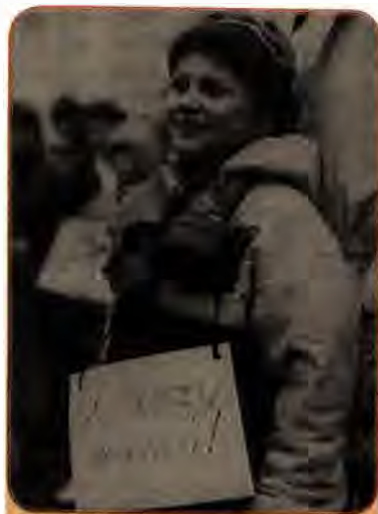
Юна учасниця мітингу на захист навколишнього середовища. Київ. 1986 р.

Виникало багато запитань, на які всі шукали відповіді. Ядерна катастрофа відкрила мільйонам українців очі на колоніальне по суті становище їх республіки. Наслідки трагедії стосувалися усіх жителів України незалежно від соціального статусу, професії, політичних поглядів, національності, віку і статі. Поняття «Чорнобиль» стало алегорією. Заговорили про «духовний Чорнобиль», «мовний Чорнобиль», «культурний Чорнобиль» і т. ін. Питання про Чорнобиль перетворилося на одне із центральних в протистоянні українських опозиційних сил з комуністичним