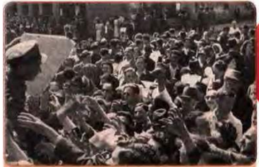
Чернівці. Після приєднання Північної Буковини до СРСР. Червень 1940 р.

тієї частини Північної Буковини, де проживало переважно українське населення. Не маючи підтримки від Німеччини, уряд Румунії віддав своїм частинам наказ залишити вказані в ультиматумі території. Там була встановлена радянська влада. Північна Буковина і придунайські українські землі ввійшли до складу УРСР. Законодавче закріплення нових територій у складі Радянського Союзу відбулося шляхом створення нової союзної республіки – Молдавської РСР і поділу території Бессарабії між Молдавською та Українською РСР. До складу Молдавії увійшла й була вилучена зі складу УРСР також частина українських історичних земель Придністров'я, де ще в 1924 р. була утворена Молдавська Автономна Радянська Соціалістична Республіка у складі Української РСР.