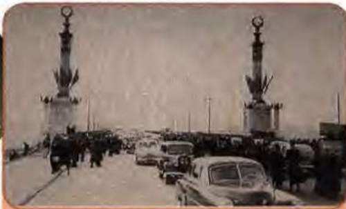
Урочисте відкриття мосту ім. Є. Патона – перший у світі суцільнозварений міст. Київ. 1953 р.

туту синтетичних надтвердих матеріалів АН УРСР 1961 р. одержав перші штучні алмази. Україна залишилася центром досліджень у галузі електрозварювання, яку очолював академік, президент АН УРСР Б. Патон.