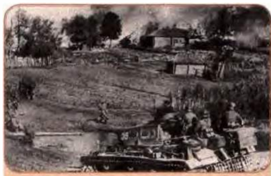
Німецький танк в'їжджає в один з населених пунктів України. Радянські солдати здаються в полон. Жовтень 1941 р.

Позбавлені організованого керівництва, військові масово здавалися в полон. У листопаді 1941 р. у на-