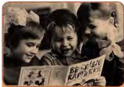
У дитячих яслах-садку. Київ. 1981 р.

Істотні зміни почали відбуватися у складі працездатних. Їхня частка в населенні зменшилася протягом 1959–1989 рр. з 59,5 % до 55,8%. Одночасно – з 13,5 до 21,2 % – збільшився відсоток осіб пенсійного віку. Це більше ніж у будь-якій іншій республіці СРСР.