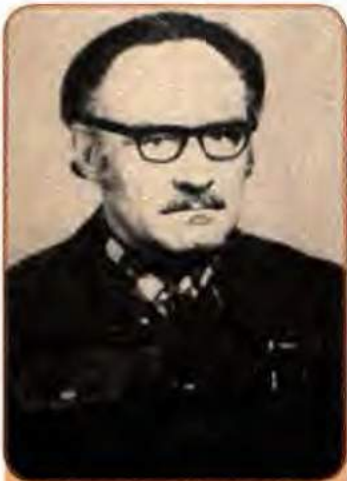
Іван Світличний – український дисидент, літературознавець і поет

Іншою формою діяльності дисидентів стало поширення підготовлених ними книжочок, статей, відеозв, що викривали і засуджували політику влади. Ці матеріали потайки переписувалися, передруковувалися, передавалися з рук у руки. Така система поширення інформації називалася «самвидавком» – за іронічним висловом російського дисидента В. Буковського: «Сам пишу, сам цензурую, сам видаю, сам поширюю і сам відсиджую».