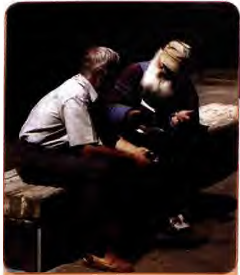
Пенсіонери обговорюють останні новини. Київ. 1993 р.

Життя змушує шукати нові системні підходи. Зокрема, пропонується введення накопичувальної системи, коли кожен громадянин матиме свій