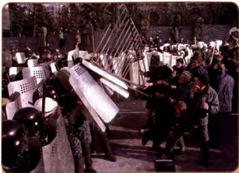
Сутички під час акції «Україна без Кучми». Київ, 2001 р.

Лідером Фронту стала Юлія Тимошенко – молодий політик, яка ще недавно була віце-прем'єром, контролювала питання функціонування паливно-енергетичного комплексу і була звільнена з посади Л. Кучмою. Серед її прихильників поширювалася думка, що Ю. Тимошенко усунули за