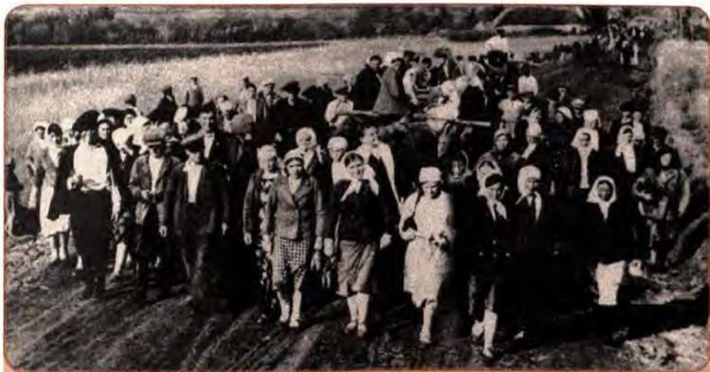
Відправлення радянських громадян на примусові роботи до Німеччини. Черкащина. 1942 р.

цевого населення, які виявили бажання співпрацювати з окупантами: бургомістри в містах, голови в районах, старости в селах, допоміжна поліція, добровольчі військові з'єднання і т.д. Серед жителів України була певна частина антирадянськи налаштованих людей, які без вагань погоджувалися служити окупантам. У сучасній науці співробітництво з нацистською Німеччиною і її союзниками називається колабораціонізмом (від франц. – співробітництво ).