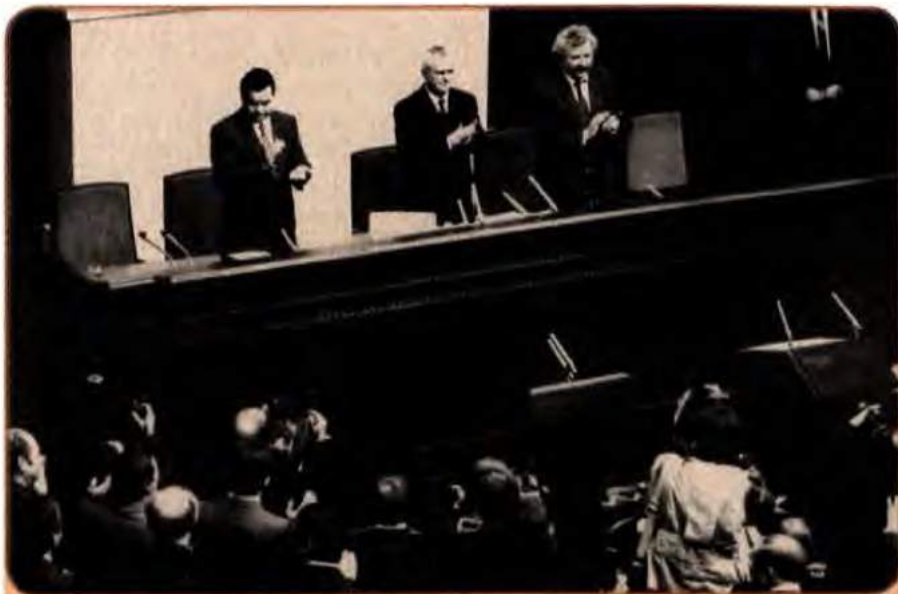
Президія Верховної Ради після ухвалення Акта проголошення незалежності України. Зліва направо: І. Плющ, Л. Кравчук, В. Гриньов.

Отже, 24 серпня 1991 р. перестала існувати Українська Радянська Соціалістична Республіка. На політичній карті світу з'явилася нова незалежна держава – Україна.