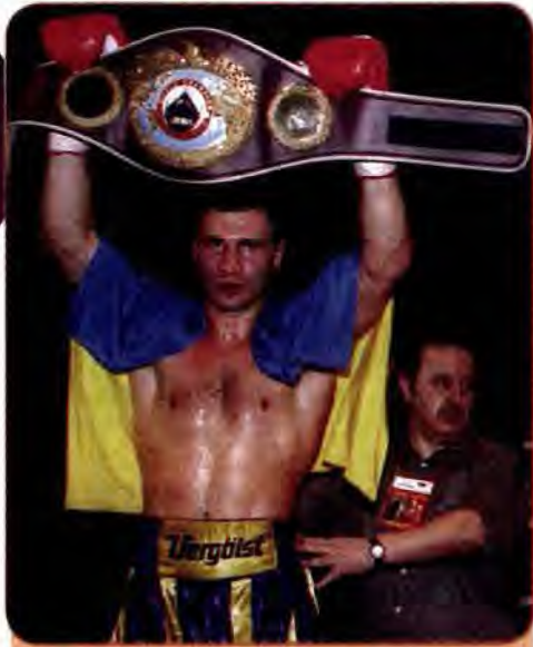
Боксер Віталій Кличко піднімає над головою свій пояс чемпіона світу за версією WBO після перемоги над Х. Хайдом. Лондон. Червень 1999 р.

буває в центрі уваги державних структур. Сформована система морального і матеріального заохочення спортсменів і тренерів. Кращим з кращих присуджуються спортивні звання «Заслужений майстер спорту України», «Майстер спорту міжнародного класу», «Заслужений тренер України». Переможці Олімпійських ігор та інших престижних змагань одержують грошові винагороди.