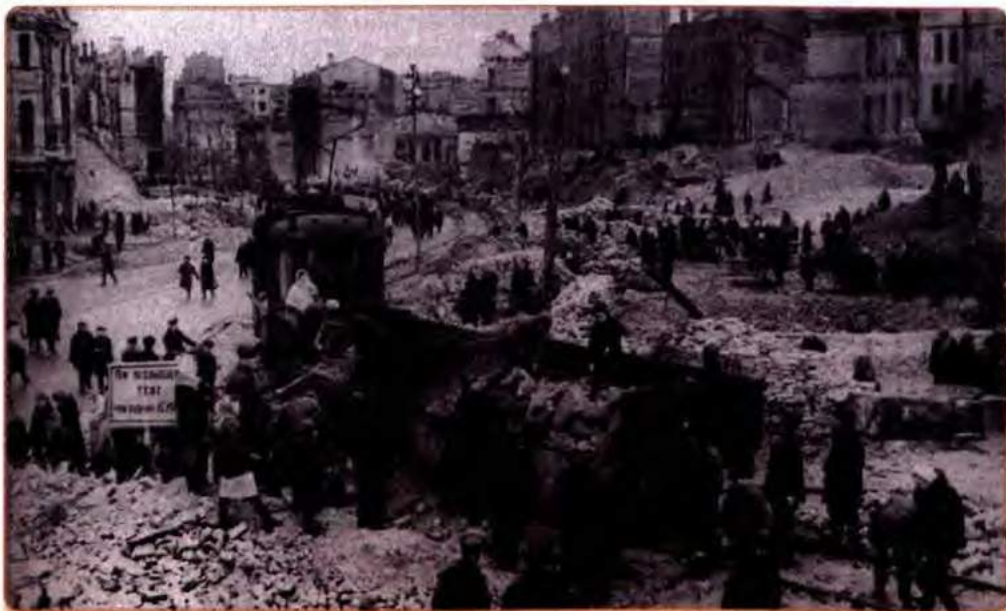
Київ на відбудові вулиці Хрещатик. 1944 р.

За роки війни Україна втратила 8 млн осіб – п'яту частину населення: 2,5 млн осіб загинули в боях, 5,5 млн становили знищені військовополонені й цивільні особи. Якщо ж взяти всі демографічні втрати (крім убитих, вони включають померлих від хвороб і голоду, депортованих, мобілізованих, емігрантів, втрати в природному прирості), то вони обчислювалися неймовірно великою цифрою – 14,5 млн. В 1945 р. в Україні залишилося 27,4 млн людей, тоді як у 1941 р. їх було близько 42 млн.