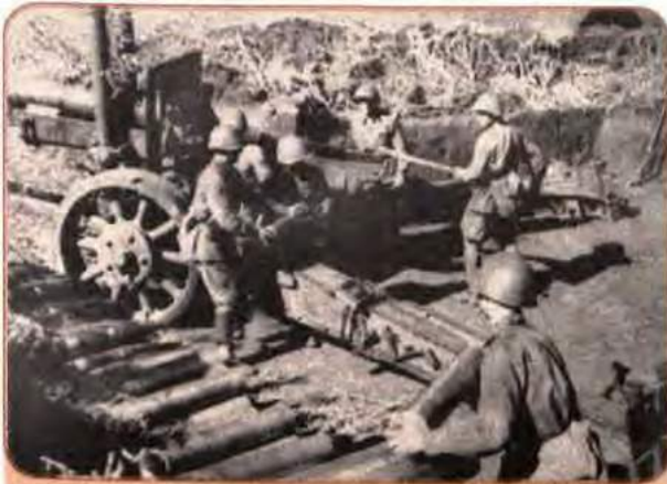
Артилеристи обороняють о. Хортиця. Запоріжжя. 1941 р.