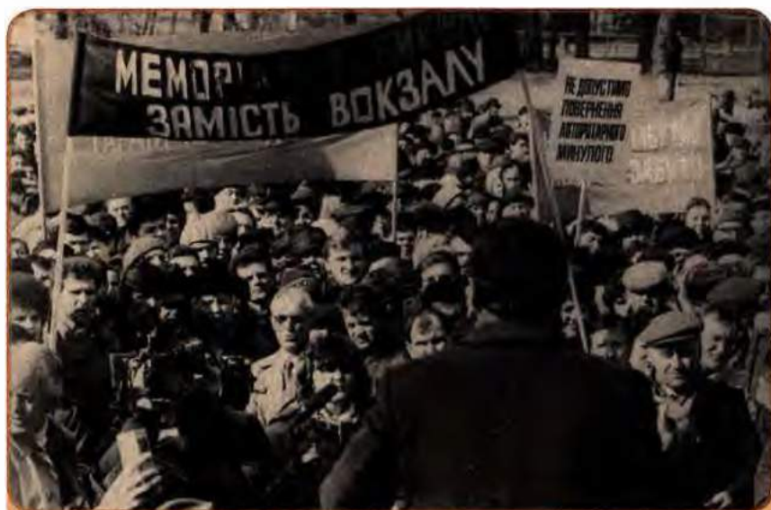
Мітинг, присвячений створенню в Україні історико-просвітницького товариства «Меморіал». Київ. 1989 р.

У травні 1989 р. на хвилі розвінчування культу особи Й. Сталіна у Києві відбувся установчий з'їзд Українського історико-просвітницького товариства «Меморіал» . Приїхало близько 500 делегатів, які представляли 70 міських і багато сільських об'єднань. На з'їзді ухвалено рішення про необхідність активізації роботи щодо реабілітації жертв політичних репресій, вшанування та повернення пам'яті про невинно репресованих, привернення уваги до білих плям української історії, перегляд місця й ролі в ній окремих постатей та подолання комуністичних стереотипів. Зверталася увага на необхідність ліквідації топонімів з прізвищами людей, які зганьбили себе причетністю до масових репресій та поновлення історичних назв. Резолюції конференції «Меморіалу» були підтримані учасниками багатотисячного мітингу, який відбувся 5 березня 1989 р. під гаслом «Ніхто не забутий, ніщо не забуте».