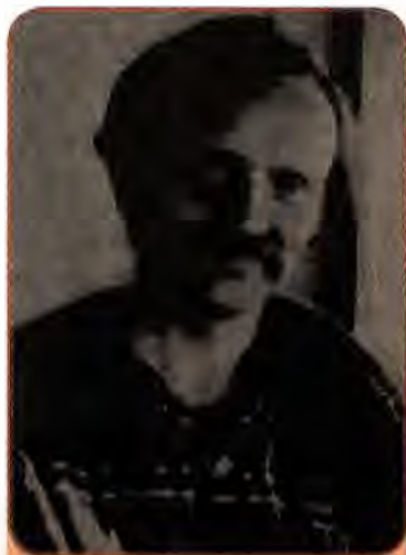
Вячеслав Чорновіл під час ув'язнення

Крім системи тюремно-табірних установ, на захист тоталітарного режиму було поставлено каральну психіатрію. Деяких дисидентів, яких було важко звинуватити в порушенні відповідних статей Кримінального кодексу, винахідливі радянські інквізитори оголошували божевільними і направляли до психіатричних лікарень спеціального типу. Серед них виділялася Дніпропетровська, яку було перетворено на справжню психіатричну в'язницю. Сотні невинних людей у жахливих умовах «психушок» несли кару за свої ідеали.