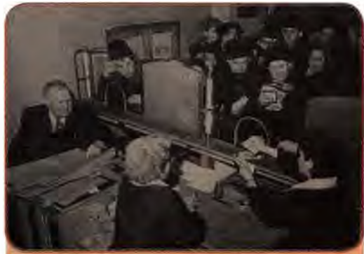
Київня обмінюють старі гроші на нові. 1961 р.

Через західну культуру, фільми, кінофестивалі, виставки тощо в міста проникають нові віяння моди. У другій половині 50-х років у містах з'явилися молоді люди, які своїм одягом, зачіскою і манерою поведінки копіювали героїв західних кінофільмів. Їх називали «стилягами» і звинувачували в низькопоклонстві перед Заходом. Але з часом до них звикли. Населення, особливо молодь, прагнули одягатися різноманітніше, сучасніше. Дедалі частіше звер-