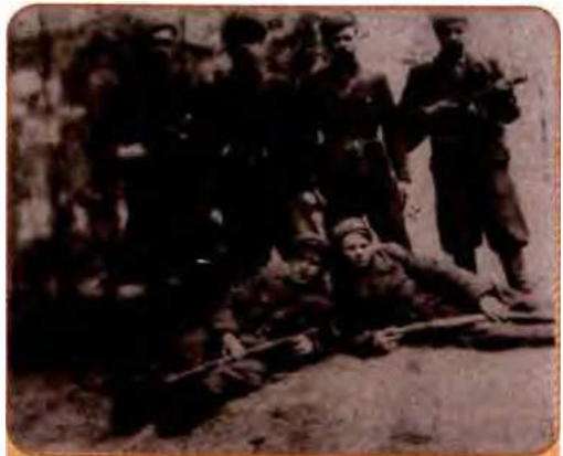
Неустійний відділ УПА. Волинь. 1940-ві рр.

Волинь з Поліссям стали центром формування УПА не випадково. Тут окупанти провадили особливо жорстоку політику. Було спалено село Кортеліси на Ковельщині, а його жи-