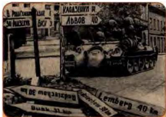
Радянські війська на вулицях одного з населених пунктів Львівської обл. 1944 р.

Останній населений пункт УРСР в її довоєнних межах – село Лавочне Дрогобицької області – визволили від гітлерівців 8 жовтня 1944 р. Офіційним днем завершення вигнання військ Німеччини та її союзників вважається 14 жовтня 1944 р., коли відбулось урочисте засідання в Києві. Що ж до Закарпатської України, то війська 4-го Українського фронту завершили її звільнення від гітлерівців 28 жовтня 1944 р.