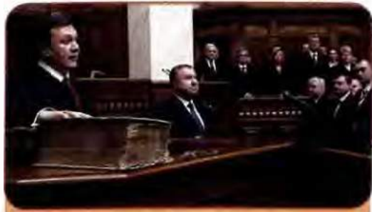
Президент України Віктор Янукович складає присягу на вірність українському народу. Лютий 2010 р.

31 жовтня 2010 р. у відповідності з новим законом відбулися вибори депутатів до місцевих рад і вибори сільських, селищних і міських голів. Україна одержала місцеву владу на 5 наступних років.