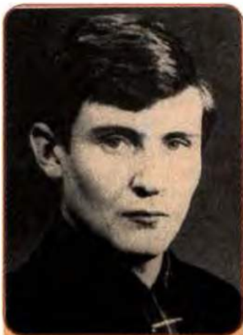
Володимир Івасюк – один з основоположників сучасної української естрадної музики