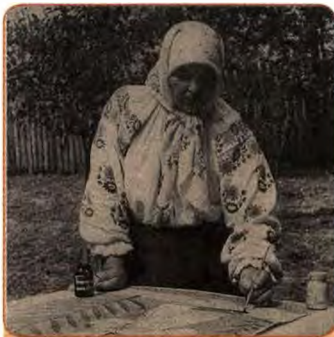
Народна художниця УРСР М. Приймаченко (Приймаченко) за роботою. Село Болотня Іванківського району на Київщині. 1969 р.