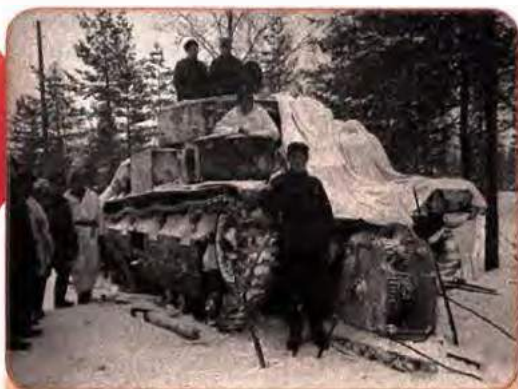
Солдати фінської армії біля захопленого радянського танка. 1939 р.

регла незалежність, а радянські втрати вбитими і зниклими безвісти становили майже 200 тис. осіб. Серед них були десятки тисяч жителів України.