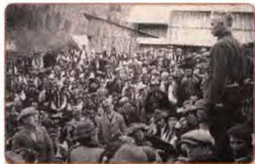
О. Довженко промовляє на передвиборчих зборах в одному з гуцульських сіл. 1939 р.

У квітні – травні 1940 р. у Катинському лісі під Смоленськом, а ще раніше під Харковом та в інших місцях було розстріляно понад 15 тисяч польських офіцерів – від молодших командирів до генералів.