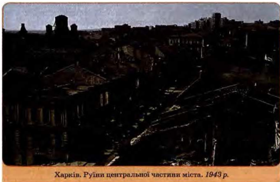
Харків. Руїни центральної частини міста. 1943 р.

У час, коли тоталітарний сталінський режим відновлював контроль над Україною, регулярні частини Червоної армії вели кровопролитні наступальні бої за її кордонами. На цьому етапі війни кожен 4–5-й червоноармієць був жителем України. Своїм ратним подвигом у складі багатонаціональних радянських з'єднань вони наближали спільну перемогу над нацистською Німеччиною, яка прийшла 9 травня 1945 р. , і забезпечували розгром милітаристської Японії, із завершенням якого 2 вересня 1945 р. пов'язане закінчення Другої світової війни.