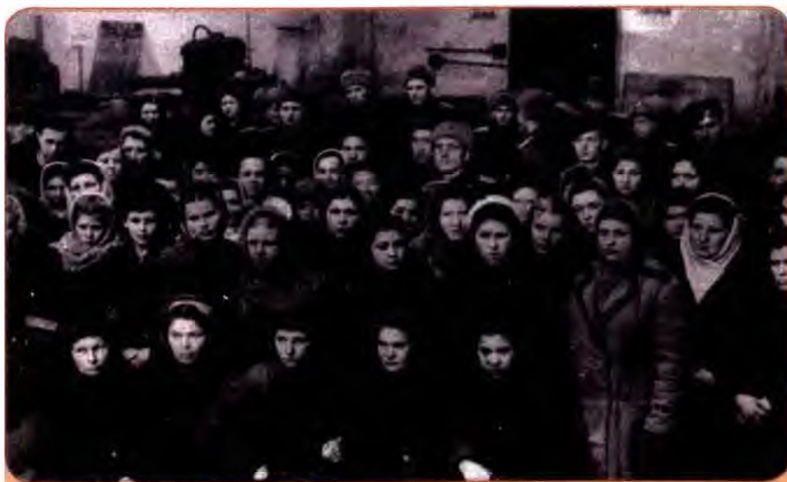
Мітинг на заводі «Арсенал», присвячений грошовій реформі та скасуванню продовольчих карток. Київ, 1947 р.

дефіцитні, стануть доступнішими. Вважалося, що це станеться вже 1946 р., але у зв'язку з катастрофою в сільському господарстві скасування було перенесено.