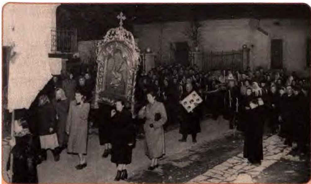
Великий хресний хід. Дрогобиччина (сучасна Львівська обл.). 1958 р.

обласної ради. Ця процедура спрощувалася. Культовий об'єкт міг бути закритий на підставі акта технічної комісії та висновку уповноваженого у справах культів при облвиконкомі. Культові споруди закривали і навіть демонтували «у зв'язку з реконструкцією населених пунктів», як мотивували свої дії власті. Священики позбавлялися можливості контролювати фінанси релігійних громад, не мали права керувати їхньою практичною діяльністю. Державні податки на релігійні громади сягали понад 80 %. Релігійна громада мала право наймати священнослужителя тільки тоді, коли він отримував реєстраційне посвідчення уповноваженого в справах культів при облвиконкомі.