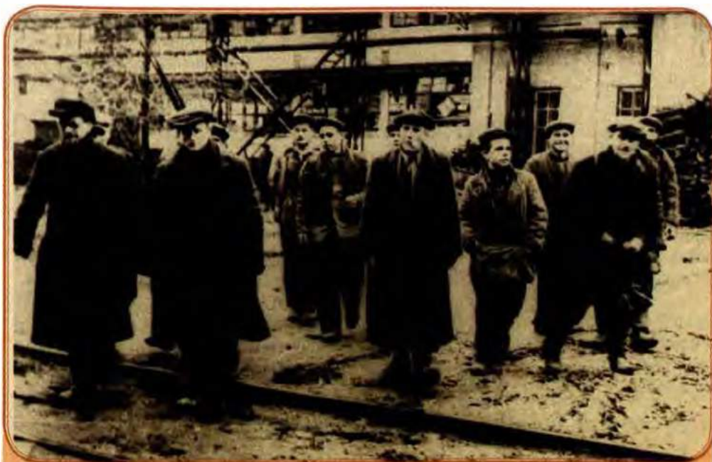
Робітники суднобудівного заводу «Ленінська кузня» повертаються на свої робочі місця. Київ. 1943 р.

Суди над колаборантами здійснювали власті всіх визволених від гітлерівської окупації країн. Співробітництво з нацистами (колаборація) скрізь викликало презирство й ненависть. Але ніде це поняття не тлумачилося так широко, як у СРСР.