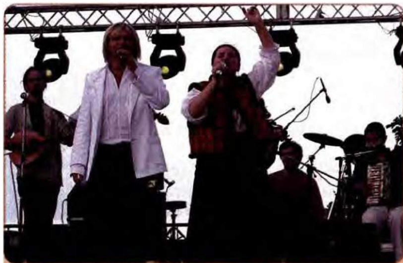
О. Скрипка та Н. Матвієнко виступають на етнічному фестивалі «Країна Мрій», 2007 р.

Незважаючи на велику кількість законодавчих актів, спрямованих на захист свободи слова, прав журналістів та інших громадян України, у більшості випадків законодавство неефективно у відстоюванні інтересів журналістів.