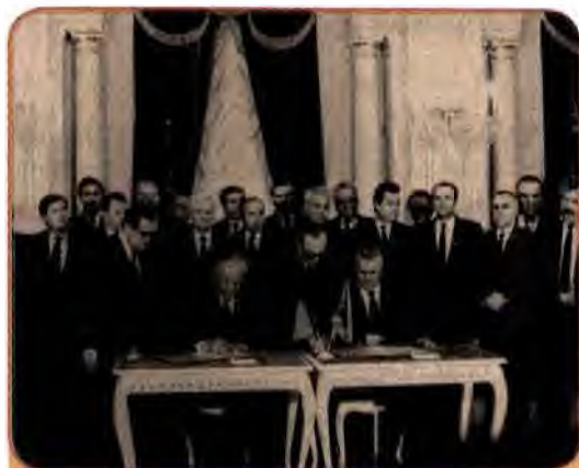
Голови Верховних Рад УРСР та РРФСР Л. Кравчук і Б. Єльцин підписують договір між двома республіками. Київ, 1990 р.

У лютому 1989 р. завершився вивід радянських військ з Афганістану, а «неоголошена війна» в цій країні, у ході якої загинуло понад 15 тис. радянських громадян, у т.ч. 2378 вихідців України. II з'їздом народних депутатів СРСР була визнана політичною помилкою.