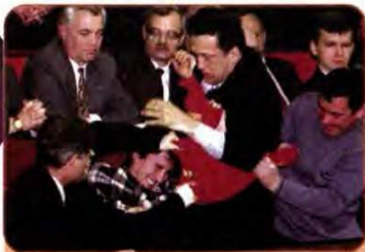
Прихильники правих фракцій у Верховній Раді видирають червоний прапор з рук своїх опонентів. Київ. 8 лютого 2000 р.

вести у квітні 2000 р. референдум, у ході якого народ повинен був висловити свою думку щодо надання Президенту права розпускати Верховну Раду, якщо в ній не буде сформовано депутатську більшість чи вона своєчасно не прийме Державний бюджет (у діючій Конституції права на розпуск парламенту Президентом взагалі не було передбачено), скасування депутатської недоторканності та скорочення числа депутатів парламенту з 450 до 300 осіб. Без таких змін, переконували Л. Кучма і його оточення, необхідні для подальшого розвитку України ринкові реформи провести буде неможливо.