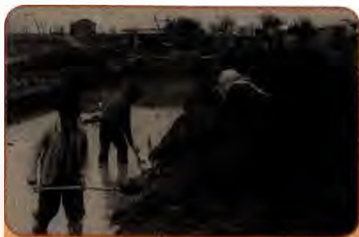
Будівництво зрошувальної системи в колгоспі ім. Жовтневої революції на Одещині. 1949 р.

Успішна відбудова електроенергетики й вугільних шахт Донбасу сприяла відродженню металургійної та інших базових галузей народного господарства України. Наприкінці п'ятирічки видобуток залізної руди і виробництво прокату чорних металів перевищили рівень 1940 р. Ціною