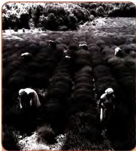
Прополкування лаванди у Мало-Маяцькому радгоспі поблизу Алушти. Крим. 1957 р.

Основною впровадження кукурудзи, яку щедро величали «царицею полів», стали неекономічні, а примусові акції. Ставка робилася на партійно-державний апарат, а не на господарську доцільність, не враховувалися властивості ґрунту, клімат та ін. З 1958 до 1963 р. посівні площі, зайняті цією культурою,