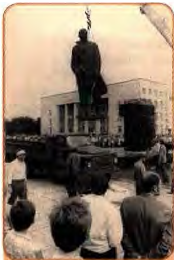
Демонтаж пам'ятника В. Леніну в м. Червоно- граді на Львівщині. 1990 р.

Склалися умови, за яких зближувались інтереси різних соціальних груп українського населення, і на перший план виступало прагнення до суверенітету республіки. Українська партійно-державна номенклатура прагнула самостійності у розв'язанні питань з управління територією; українське селянство, повернувшись обличчям до свого минулого – колективізації, депортацій і голодоморів, безпосередньо пов'язувало це з політикою Москви. Робітники також все більше пов'язували надії на покращення свого становища з розширення прав України. І нарешті, українська інтелігенція, представники дисидентства в досягненні незалежності вбачали здійснення віковичної мрії українського народу.