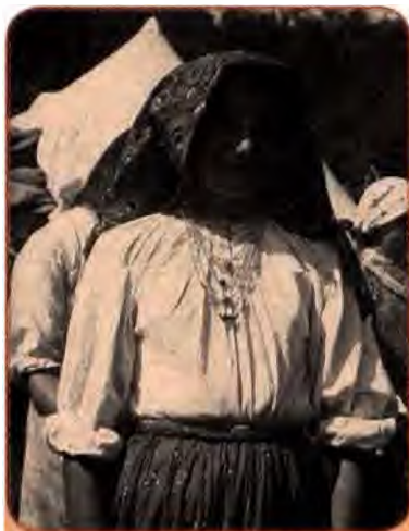
Лемкиня. 1940 рр.

При цьому прикривалися необхідністю ліквідації на цих територіях залишків формувань УПА. Було виселено зі своїх домівок та відправлено на захід Польщі близько 150 тис. осіб. Переїзд та розміщення українців на нових землях стали справжньою