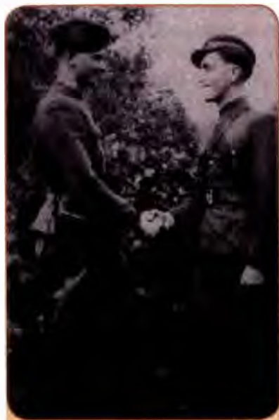
Командири УПА «Чорнота» (ліворуч) і «Чорний». Західна Україна. 1940-ві рр.

Антигітлерівський рух Опору існував в усіх окупованих країнах Європи. Але майже скрізь він, крім внутрішньої підтримки населення, спирався на надійну зовнішню підтримку (еміграційні уряди і держави антигітлерівської коаліції). Український національний рух Опору зовнішньої підтримки не мав. Англія, США, зв'язані з СРСР союзними зобов'язаннями, навіть