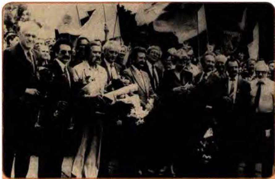
В. Чорновіл (третій праворуч) та інші діячі Народного руху України на мітингу, Київ, 1990 р.

Народний рух України за перебудову, як найбільша з новоутворених громадсько-політичних організацій, зробив чимало для демократизації виборчої системи в республіці, утвердження української мови як державної, оприлюднення правди про трагічні сторінки історії українського народу. На адресу Руху з боку Компартії України посипалося безліч критичних стріл.