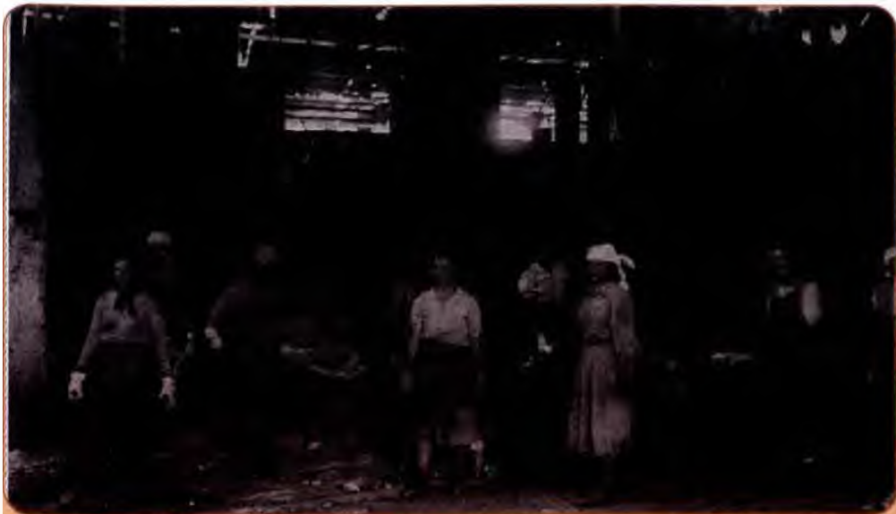
Відбудова мартенівської печі № 5 металургійного заводу ім. К. Ворошилова. Ворошиловград (сучасний Луганськ). 1944 р.

що становило 24 % загальної суми, наданої урядом СРСР на відбудову радянських територій. Що ж до матеріальних збитків, яких зазнала Україна в роки війни, то вони становили 42 % загальних збитків СРСР.