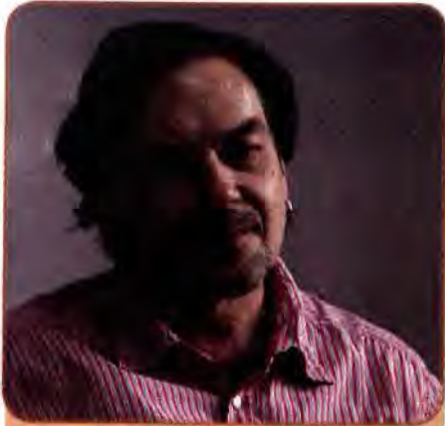
Юрій Андрухович – один із засновників постмодерністської течії в українській літературі