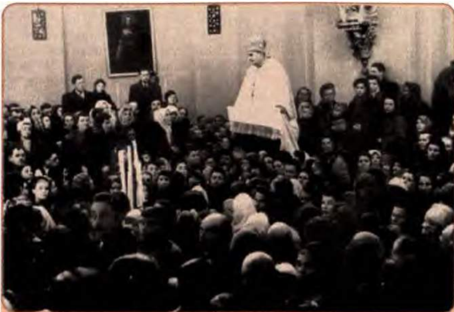
Г. Костельник промовляє після богослужіння. Львів, 1949 р.

Жертвою репресій стала й Українська греко-католицька церква (УГКЦ), яка на період закінчення Другої світової війни мала 3040 громад, 4400 церков, 127 монастирів, близько 4 тис. священнослужителів та 5 млн віруючих. Московська правляча верхівка вбачала в українських греко-католиках потенційного ворога, який створював ідеологічне підґрунтя національно-визвольної боротьби в західних областях. Радянське керівництво ініціювало «саморозпуск» УГКЦ. 11 квітня 1945 р. заарештовано значну кількість єпископів УГКЦ на чолі з митрополитом Йосипом Сліпим. Майже через рік (8 березня 1946 р.) у кафедральному храмі Св. Юра відбувся Львівський церковний Собор . На ньому «ініціативна група», очолювана єпископом Гавриїлом Костельником, запропонувала «возз'єднання УГКЦ» з московським православ'ям і повернення до Російської православної церкви, ліквідацію Берестейської церковної унії 1596 р. і повний розрив із Ватиканом.