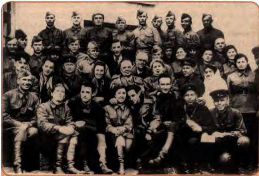
Артисти фронтової бригади Київського українського театру ім. І. Франка. В центрі – Г. Юра. 1942 р.

входили такі визначні діячі української культури, як З. Гайдай, І. Паторжинський, П. Вірський та ін.