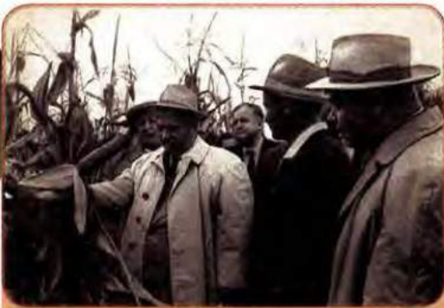
М. Хрущов оглядає врожай кукурудзи

зросли більш як удвічі, а валовий збір – лише в 1,3 раза. Практично незмінною – у межах 25–28 центнерів з гектара – залишалася врожайність кукурудзи. Очікуваного ефекту кукурудза не дала, зате в багатьох районах призвела до порушення сівозмін, структури ґрунтів, зниження врожайності зернових. Становище сільського господарства ускладнив також неврожай 1963 р.