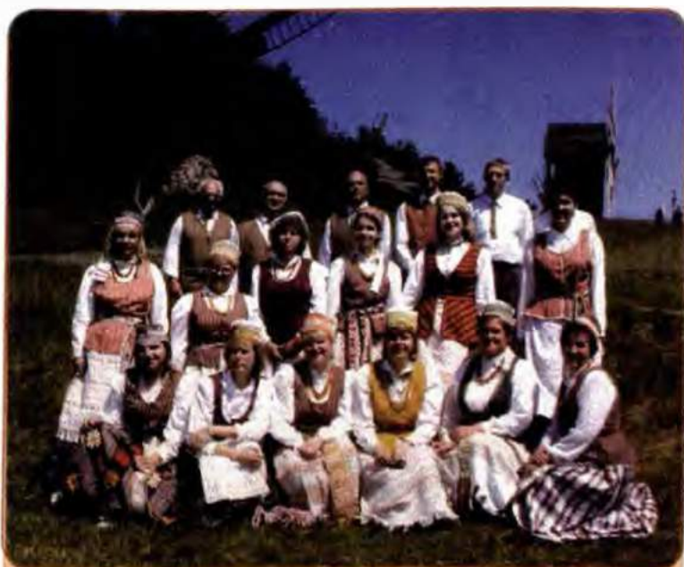
Литовський самодіяльний колектив на святі національних культур у Києві

У прийнятій 1 листопада 1991 р. Верховною Радою Декларації прав національностей України підкреслювалося, що Україна гарантує всім народам, національним групам, громадянам, що проживають на її території, рівні економічні, політичні, соціальні та культурні права.