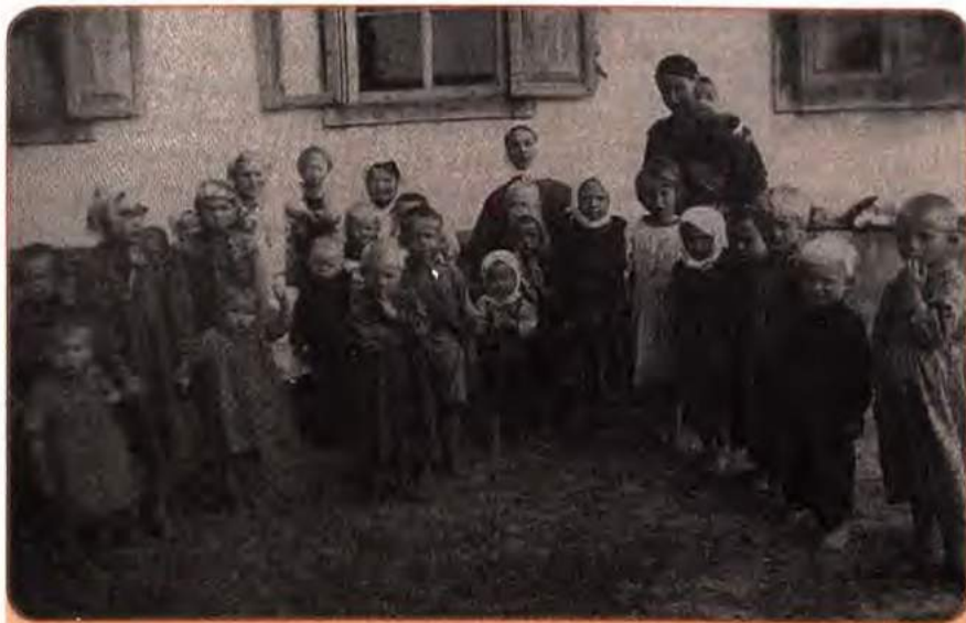
У дитячих яслах колгоспу «Більшовик» на Сумщині. 1952 р.

дукції машинобудування більше, ніж у будь-якій іншій республіці СРСР. Цукор, 70 % виробництва якого зосереджувалося в Україні, дуже рідко потрапляв на стіл трудящих республіки. Те саме було й із соняшниковою олією. Реальні прибутки переважної більшості працівників, як у місті, так і на селі, були нижчими від довоєнного рівня. Нарощування виробництва сільськогосподарської продукції відбувалося меншими темпами, ніж приріст населення, який у післявоєнні роки був значним.