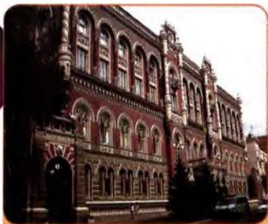
Будинок Національного банку України. Київ

кову службу України, у червні 1991 р. був прийнятий Закон про митну справу в Україні. Повноцінна діяльність цих органів державного управління почалася після проголошення незалежності.