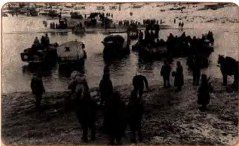
Механізовані частини 1-го Українського фронту форсують річку Тетерів неподалік від м. Коростишів на Житомирщині. 1944 р.

24 січня в напрямку Шпола–Звенигородка почав наступ 2-й Український фронт. Наступного дня назустріч йому рушило ударне угруповання 1-го Українського фронту. Долаючи відчайдушний опір, війська просувалися вперед, доки, нарешті, не з'єдналися 28 січня в районі Звенигородки. В оточенні опинилося близько 80 тис. гітлерівців. Їхнє становище було безнадійним. 8 лютого радянське командування висунуло їм ультиматум про негайну капітуляцію. Після відмови німців здатися війська почали операції зі знищення оточених. Було вбито і поранено 55 тис. солдатів і офіцерів, 18 тис. потрапили в полон.