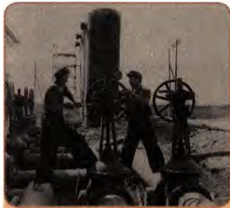
На будівництві газопроводу Дніпропетровськ-Кривий Ріг. 1959 р.

На середину 60-х років питома вага машинобудування в загальному обсязі промислового виробництва зростає до 25 %. У цей час у республіці з'явилася нова галузь промисловості – легкове автомобілебудування (Запоріжжя). Розпочався випуск найбільших у світі суховантажних суден та риболовецьких траулерів у Миколаєві. Значних успіхів досягло авіабудування – було налагоджено випуск нових типів пасажирських і транспортних літаків високого класу. З 1960 р. завдяки творчому співробітництву авіабудівників Києва і моторобудівників Запоріжжя розпочато виробництво реактивних повітряних лайнерів Ту-124.