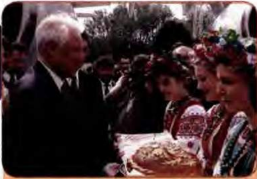
Державний візит в Україну Президента РФ В. Єльцина. Київ, 1997 р.

основі принципів взаємної поваги та суверенної рівності, територіальної цілісності, непорушності кордонів та інших загальноприйнятих принципів міжнародного життя. Договір було укладено на 10 років.