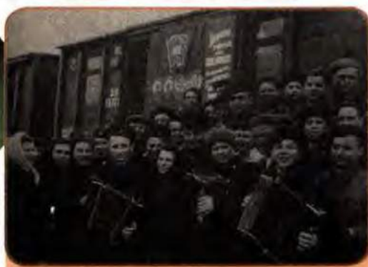
Від'їзд молоді на будівництво залізниці Кустанай–Золота Сопка в Казахстані. Київський вокзал. 1955 р.

цілинних та перелогових земель багато писали в газетах, журналах, велися передачі на радіо. У Казахстан і на Алтай з України виїхало понад 100 тис. чоловік, переважно молоді. Частина з них пізніше повернулася додому, інші залишилися працювати в створених там зернових радгоспах, до яких активно надсилалася техніка. Лише 1955 р. з України було відправлено близько 11,4 тис. тракторів і 8,5 тис. комбайнів. Вони й заклали основу технічної бази новоорганізованих господарств.