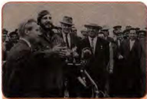
Урядова делегація УРСР зустрічає керівника Куби Ф. Кастро. Київ, 1963 р.

Це був серйозний крок на шляху стримування гонки озброєнь, і навіть формальна причетність до нього України викликала в суспільстві позитивні емоції.