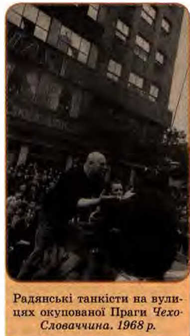
Радянські танкісти на вулицях окупованої Праги Чехо-Словаччина. 1968 р.

Однак ніякі штучні перепони не могли відгородити Україну від зарубіжного світу. Світ вступав у добу інформації, і про те, чого не побачив, можна було почути по радіо, яке стало загальнодоступним.