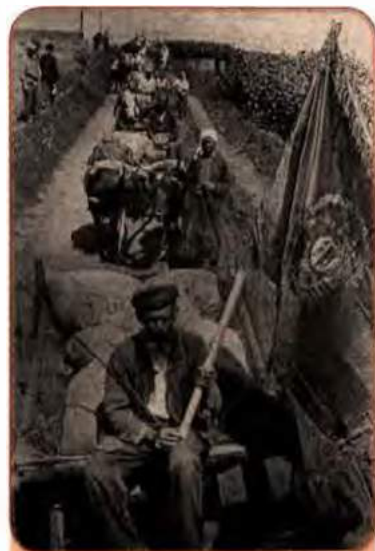
Трудівники колгоспу ім. Т.Г. Шевченка на Київщині везуть здавати зібраний урожай. 1944 р.

Значних успіхів удалося досягти у відбудові основних галузей народного господарства. На кінець війни питома вага Донбасу в загальносоюзному видобутку вугілля зросла до 26,7 %. У 1945 р. Україна дала 18 % загальносоюзного виробництва чавуну і 11,2 % сталі.