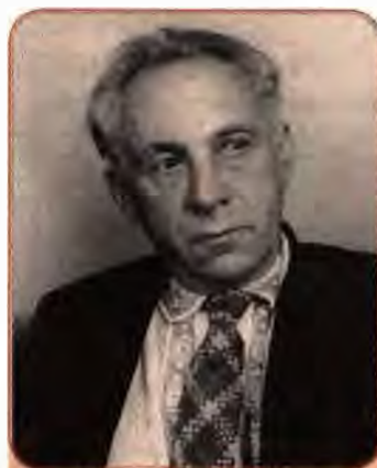
Максим Рильський видатний український поет, редактор

Зрозуміло, що репресії та утиски творчої інтелігенції не могли не зачепити українських митців. Западливі сталінські прислужники в ЦК КП(б)У, відповідно до рішень ЦК ВКП(б), прийняли свої постанови: «Про перекручення і помилки у висвітленні історії української літератури в “Нарисі історії української літератури”», «Про журнал сатири і гумору “Перець”», «Про журнал “Вітчизна”», «Про репертуар драматичних і оперних театрів УРСР і заходи щодо його поліпшення». Кожна з цих постанов су-