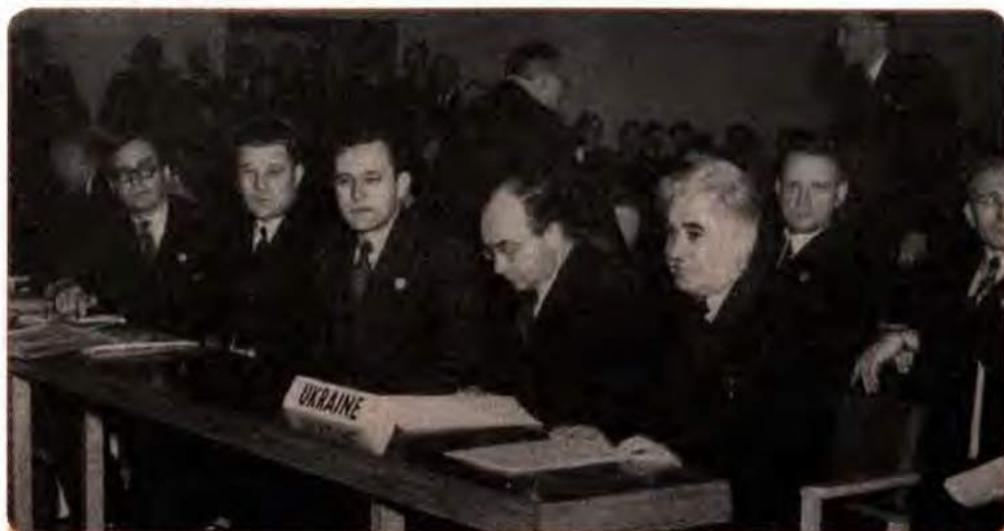
Члени делегації УРСР на Першій сесії Генеральної Асамблеї ООН. Лондон. 1946 р.

ками Німеччини і поставила свій підпис під мирними договорами з Болгарією, Італією, Румунією, Угорщиною, Фінляндією. З іншого боку, договори про польсько-радянський кордон і Закарпатську Україну СРСР підписував без участі УРСР.