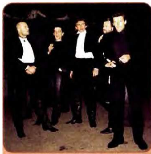
Культурний рок-гурт «Кому вниз», учасник фестивалю «Червона рута». 1990 рр.

Кіномистецтво України, що має сталі традиції, в роки незалежності значно