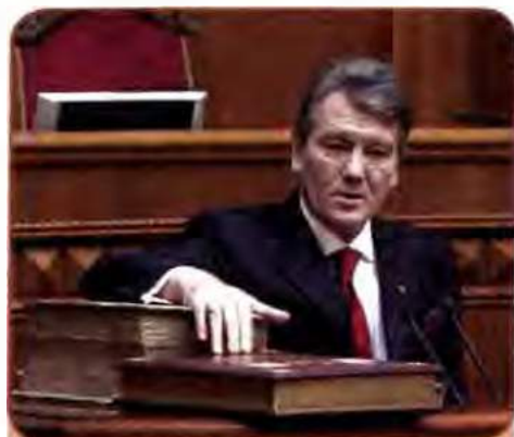
Президент України Віктор Ющенко складає присягу на вірність українському народу. 2005–2010 рр.

Повторне голосування принесло перемогу В. Ющенку. Він одержав 51,99 % голосів, а В. Янукович – 44,2 %. 23 січня 2005 р. у Верховній Раді України та на майдані Незалежності В. Ющенко склав присягу Президента України.