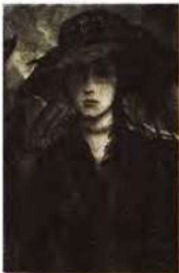
І. Глазунов. Ілюстрація до вірша О. Блока «Незнайома», 1978 р.

Олександр Блок постійно відчуває тривожну необхідність шукати нових шляхів, високих ідеалів. І саме ці напружені пошуки нових цінностей вирізняють його з-поміж внутрішньо самовдоволених декадентів. У знаменитому вірші « Незнайома » (1906) ліричний герой схвильо-