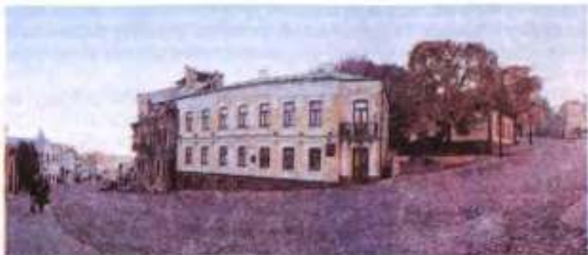
Музей М. Булгакова (дім Турбінних), м. Київ

ста років відбулося кілька революцій, було повалено самодержавство, розбудований «найсправедливіший» в історії людства суспільний устрій – соціалізм. Аж раптом такий «вирок»: за цей час люди не змінилися.