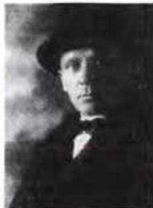
Михайло Булгаков, 1928 р.

Сумирний пес Шарик, перетворений під час хірургічного експерименту лікарем Преображенським на «пролетаря Шарикова», ледь зіп'явшись з чотирьох на дві кінцівки, почав агресивно претендувати на роль «начальника» життя і мало не зжив зі світу свого «тата» — професора. Булгаков не вірив у можливість декларованих радянською владою революційних («хірургічних») перетворень людини й суспільства, протиставляючи їм шлях природної еволюції. Переживши жахи спілкування зі своїм творінням, професор дійшов висновку: «Навіщо потрібно штурмувати фабрикувати Спіноз, коли будь-яка жінка може будь-коли їх народити! Адже ж народила в Холмогорах мадам Ломоносова цього свого знаменитого... Людство самотужки піклується про це, в еволюційному порядку щороку наполегливо виділяючи з маси різної мерзоти, створює десятками видатних геніїв, що прикрашають земну кулю» . Звісно, така позиція письменника суперечила одному з головних лозунгів більшовизму: