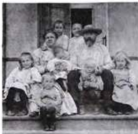
Родина Булгакових на дні. м. Буча