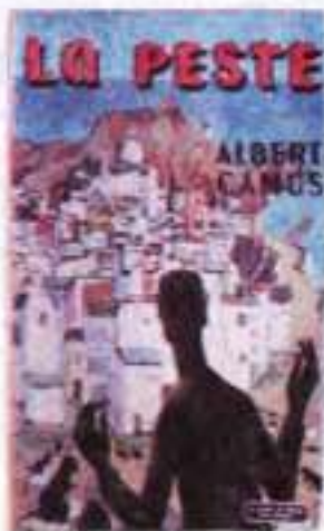
Обкладинка до роману «Чума» А. Камю

Стилізація під жанр роману-хроніки зумовлює особливості мови твору А. Камю. Підкреслена об'єктивність визначає добір лексики, позбавленої яскравого емоційно-експресивного забарвлення, а також стриманий виклад подій та коментарів до них. З подібним прийомом