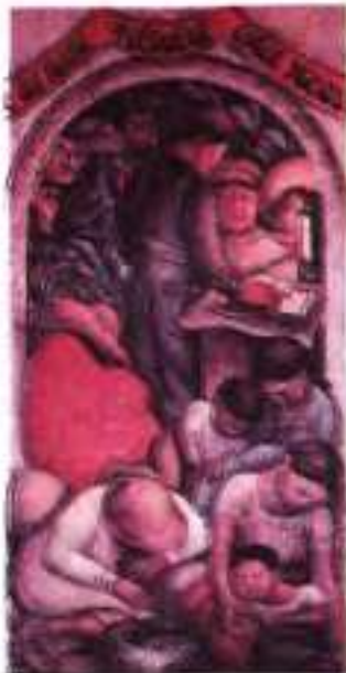
Д. Рієра. Нім бідняка. 1928 р.

Розвиток реалізму у ХХ ст. супроводжувався як втратами, так і здобутками. З одного боку, влада «саморухомого» життя не завжди стверджувала себе в літературі з такою переконливою силою, як це було у творах О. де Бальзака, Ч. Діккенса, Л. Толстого чи Ф. Достоевського. Проте, з іншого боку, голос автора звучить чимдалі «стереофонічніше» або й «поліфонічніше», він неначе «ретранслюється» через кожен з елементів художньої структури. У творах Дж. Б. Шоу, Т. Манна, Л. Піранделло, М. Унамуно, П. Барохи та ін. узагальнювальна думка автора знаходить втілення у власне естетичній тканині творчості: у самій фабулі, що подеколи має притчовий («параболічний») характер, у застосуванні різних форм алегоричності, у зверненні до умовностей і фантастики, в оповідній двоплановості, у використанні міфологічних та історичних сюжетів, у характері обраних традицій