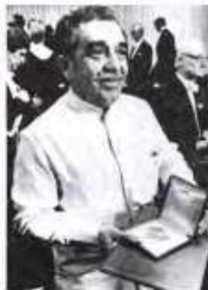
Габріель Гарсія Маркес під час вручення Нобелівської премії. 1982 р.