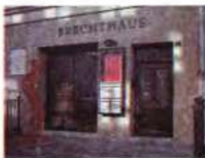
Будинок у м. Аугсбурзі, де народився Б. Брехт (нині — музей)

Після війни Брехт відновив свої заняття в Мюнхенському університеті. Однак кар'єра лікаря його вже не приваблювала, і студента частіше можна було побачити в кав'ярні «Стефанія», де збиралася богема. Життя в Мюнхені тоді було напруженим. З одного боку — потужний робітничий рух і зародження фашизму (під час так званого «нічного путчу» в Мюнхені 1923 р. ім'я Брехта було занесене фашистами до списків тих, кого треба було знищити в першу чергу), з іншого — розмаїте мистецьке й передовсім театральне життя. Певний час Брехт курсував між Мюнхеном і Берліном, знаходячись у центрі театального життя. 29 вересня 1922 р. ім'я Бертольта Брехта стало відомим усій Німеччині. Саме цього дня відбулася прем'єра його п'єси « Бій барабанів