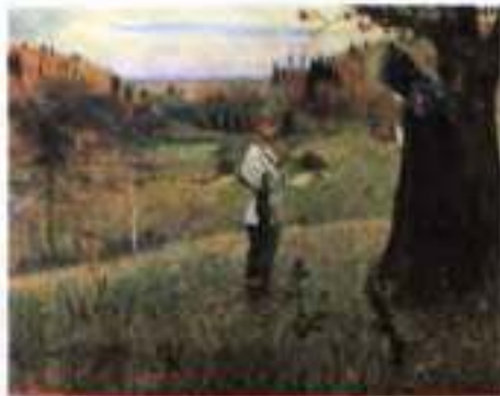
М. Нестеров. Видіння отроку Варфоломею. 1889 - 1890 рр.

У другій половині 1890-х років утворилася друга течія російського символізму. Цю течію очолювали В. Брюсов 1 і К. Бальмонт 2 , які розглядали символізм як суто літературне явище, як новий закономірний етап у світовому літературному процесі. Їхня діяльність зосередилася переважно в Москві, тому їх називали «московськими символістами». Цим письменникам притаманне імпресіоністичне сприйняття життя й прагнення до художнього оновлення російської поезії.