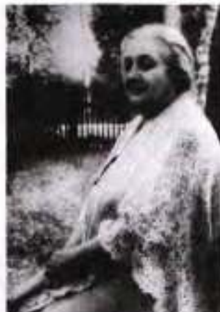
Анна Ахматова. 1960-і роки

5 березня 1966 р. А. Ахматова померла в селищі Домодедово, похована на кладовищі в селищі Комарово під Ленінградом (нині м. Санкт-Петербург).