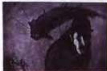
К. Гаврилова. Ілюстрації до оповідання «Перевтілення» Ф. Кафки