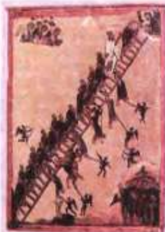
Листвиця. XII ст.

Його втілення преподобний Іоанн пояснив так: «Спорудив я листвицю сходження... від земного до святого... подібно до тридцяти років Господня повноліття, знаменно спорудив листвицю з 30 сходинок, по якій, досягнувши Господня віку, виявимося праведними й безпечними від падіння». Сходинки «Листвиці» — це велегкий шлях людини до досконалості, що може бути досягнута не зразу, а лише поступово, бо Царство Небесне отримують лише ті, хто докладає до самодосконалення величезних зусиль (Мф. 11, 12). До слова, «Листвиця» була настільною книгою М. Гоголя.