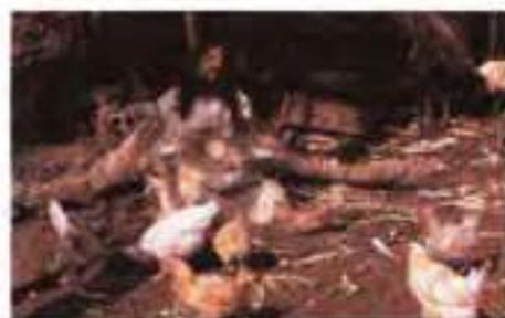
Кадр із фільму за оповіданням Г. Гарсія Маркеса «Стариган із крилами» (режисер Ф. Біррі, 1988 р.)

Персонажі оповідання порівнюють ангела чи то з комахою, чи то з якоюсь іншою небезпечною (ворожою, неприємною) для людей істотою: «Сусідка застерігала, що ангели о цій порі року дуже небезпечні» ... Ця фраза звучить так, ніби йдеться про сезонний спа-