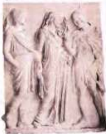
Орфей, Еврідіка, Гермес. Антична скульптура

Існує версія, що поштовхом до написання вірша став барельєф з Неаполітанського національного музею, назва якого надзвичайно подібна на підпис під барельєфом.