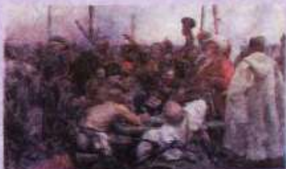
І. Рєтін. Запорозькі козаки пишуть листа турецькому султану. 1880 р.

На основі цього відомого історичного факту І. Рєтін написав знамениту картину «Запорозькі козаки пишуть листа турецькому султану».