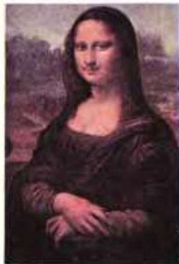
М. Дюшан. L.H.O.O.Q. 1919 р.

Початок ХХ ст. в Європі та Америці ознаменувався на всіх рівнях — у політичному житті, у соціально-побутовому укладі, у галузі науки і техніки — подіями, нововведеннями, відкриттями, які в сукупності провокували й чимдалі більше загострювали в суспільній та індивідуальній свідомості сучасників психологічні ефекти відчуження. Цілий ланцюг взаємопов'язаних явищ (від симптомів насування світової війни і аж до процесів, що відбувалися в галузі природничих наук та їх інтерпретації у філософії) сприяв утворенню певної суспільно-психологічної атмосфери, яка й позначилася на художній свідомості. Саме в цей час відбувається глибокий структурний переворот в естетичній свідомості та