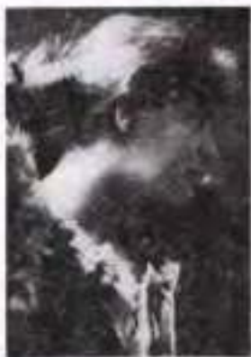
Лу Андреас-Саломе. 1900 р.

Поет зацікавився Росією завдяки химерній жінці, французенці за походженням, яка там народилася й провела дитячі роки. Саме під впливом Лу Андреас-Саломе і разом із нею протягом 1899–1900 рр. Рільке двічі побував у Росії. Спілкування з російською інтелігенцією, безкрайні простори й православ'я справили на поета надзвичайно великий вплив. Хоча Росія, як і Австро-Угорщина, була імперією, однак поет їй це «пробачав» і сприймав як єдиний духовний організм. У Москві Рільке