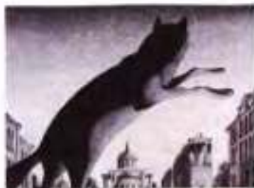
С. Алімов. Ілюстрація до роману «Майстер і Маргарита» М. Булгакова

Літератори, перетворені на «інженерів людських дум», виявляються заздрісними й жадібними до дешевих розваг, нездатними до звичайного людського співчуття. Члени правління злятаються на покійного голову, бо через його смерть їм довелося вечеряти не на веранді, а в душному залі. Булгаков змальовує контрастну картину: