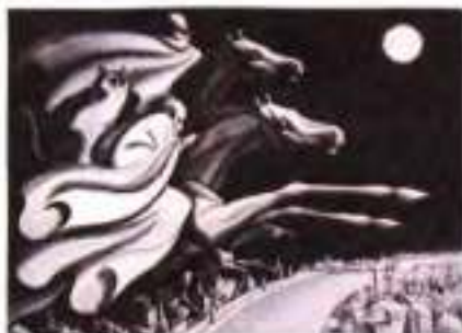
С. Азімов. Ілюстрація до роману «Майстер і Маргарита» М. Булгакова