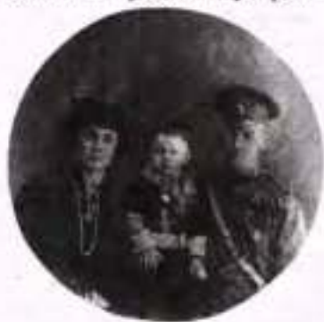
Анна Ахматова і Микола Гумільов із сином Левом. 1915 р.

У трагічні роки сталінського терору та Другої світової війни (1930–1945) А. Ахматова розділила долю більшості своїх співвітчизників, переживши арешт сина Лева Гумільова, чоловіка, загибель друзів, своє відлучення від літератури партійною