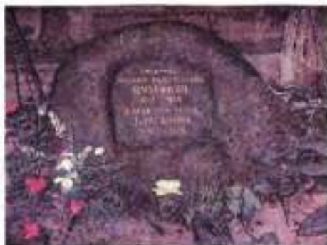
«Голгофа» — камінь з могили М. Гоголя на могилі М. Булгакова