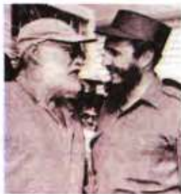
Ернест Хемінгуей і Фідель Кастро на Кубі. 1960 р.

Тим часом Е. Хемінгуей переживав чергову творчу кризу, з якої його вивели події громадянської війни в Іспанії. Письменник зразу зрозумів, яку небезпеку несе світові фашизм і що війна в Іспанії – це перша, але не остання війна з «коричневою чумою». З 1937 по 1940 р. він – кореспондент американських газет в Іспанії. Хемінгуей не лише передавав телефоном протягом кількох годин іспанські репортажі, а й брав безпосередню участь у воєнних діях на боці республіканців, чью поразку сприйняв як особисту. Результатом іспанських вражень став один із кращих романів письменника «По кому подзвін» (1940).