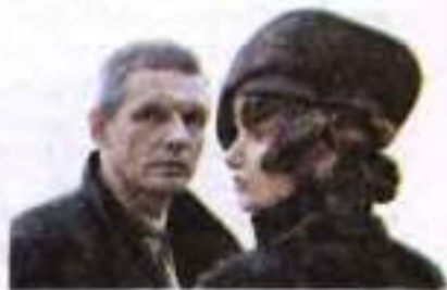
Кадр з кінофільму «Майстер і Маргарита» (режисер В. Бортко, 2005 р.)

Центральним жіночим персонажем роману є Маргарита . Традиційно її образ асоціюється з вірним і вічним коханням (хоча існують інші погляди). До позитивних рис героїні належить милосердя, адже вона домагається прощення спочатку для Фріди, а потім і для Понтія Пілата.