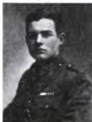
Ернест Хемінгуей замолоду. 1918 р.

Америка саме розпочала воєнні дії, і тамтешні газети закликали молодь одягти військову форму та йти «захистити цивілізацію від варварства гунів». Звісно, шляхетна Ернестова душа рвалася до доблесті, подвигів, слави. Проте батьки були категорично проти: яка американцю справа до війни в заокеанській Європі за чужі інтереси. Тож і відправили непослуха до Канзасу, де дядько Ернеста влаштував його до редакції місцевої газети «Стар» («Зірка»). Невелика практика в юнака вже була, адже ще в школі він був спочатку репортером, а потім редактором шкільної газети. Вишкід у канзасця Піта Веллінгтона, який сформулював «Сто заповідей газетяра», став першим курсом письменницьких університетів Хемінгуей.