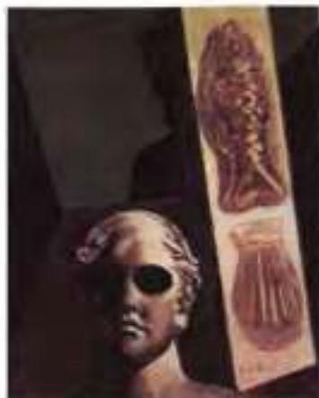
Дж. де Кіріко. Портрет П'єома Аполлінера. 1914 р.

Проте життя Аполлінера в Парижі було складним. Він мусив зареєструватися в префектурі з принизливим «титулом» безробітного іноземця. Поет дійсно шукав роботу й погоджувався на будь-яку, аби платили: працював конторником, підробляв навіть «літературним негром» 1 , писав твори, які видавали під прізвищем їхніх замовників. Тож недаремно дослідники його життя й творчості зазначають, що Аполлінер пройшов усі сходинки письменницького ремесла.