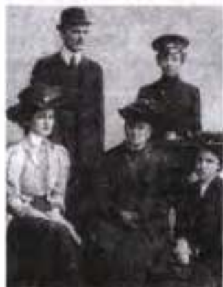
Анна Ахматова із сім'єю. м. Севастополь. 1909 р.

У цьому дружньому ура-патріотичному хорі сумний і сердечний голос А. Ахматової лунав самотою. Так, у її віршах «Липень 1914» , «Пам'яті 19 липня 1914» , «Втіха» , «Молитва» та ін. війна поставала як лихоліття, часи народної