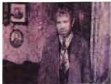
Кадр з кінофільму «Собаче серце» (режисер В. Бортко, 1988 р.)