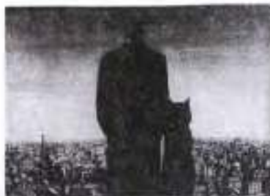
С. Азімов. Ілюстрація до роману «Майстер і Маргарита» М. Булгакова

Значно важливішим є те, що без роману Майстра про події в Єрусалаїмі концепція письменника не була б реалізованою, зокрема, зло не було б покарано. Адже добро перемагає лише в «єрусалаїмських» розділах: Пілат – носій «тоталітарної свідомості», вірний приспівник Імператора Тиберія – зрештою розкається і майже через дві тисячі років отримав прощення за злочинну страту Іешуа (звісно, за концепцією М. Булгакова). Натомість у Москві після зникнення Воладта та його слуг нічого не зміни-