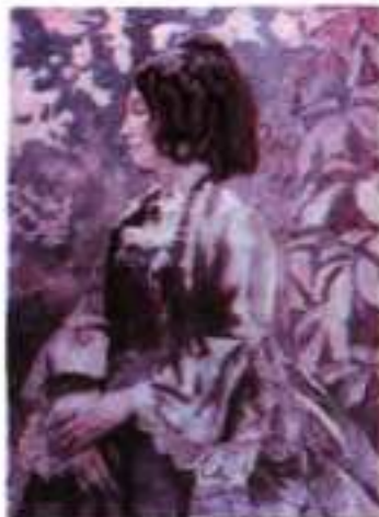
В. Борисов-Мусатов. Дама в голубому. 1902 р.

Автор ніби нагнітає неприємне враження від довкілля, уживаючи знижену лексику: замість каналів — « канави », замість принадного дзвінкого жіночого сміху — « жіночі верески і крик », а тисячі разів оспіваний романтиками та символістами місяць перетворюється на « безглуздий диск на тлі небесному, який давно до всього зник » (переклад Ю. Клена). У перших строфах перед читачем розгортається картина обивательських буднів, де панують вульгарність і непристойність. Здається, що ця примітивна й в'язка реальність рухається по колу і вирватися з неї неможливо. Ліричний герой не приховує своєї відрази до неї. Навіть весняна природа, яка надихнула майже в цей же час О. Блока на оду