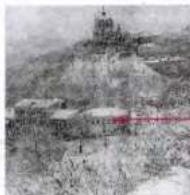
Андріївський узвіз. У центрі — будинок Булгакових, тепер музей письменника. м. Київ

На початку 1919 р. він оселився в Києві і, як написав в одній з анкет, «призивався на службу як лікар поспіль усіма урядами, які займали Місто». Коли в 1919 р. до Києва ввійшли денікінці, Булгаков також був мобілізований як військовий лікар. Далеко від рідного Києва, на чужому Кавказі з тамтешнім «губільним побутом», про який письменник згадує з дошкульною іронією (оповідання «Богема», 1921 р.), він починає писати знаменитий роман «Біла гвардія» (опублікований 1925 р.), за мотивами якого створив і п'єсу