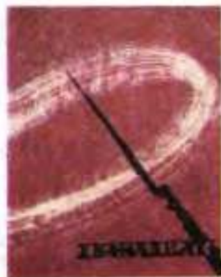
Обкладинки до видань творів О. Блока