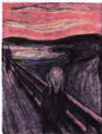
Е. Мунк. Крик. 1893 р.

У творах письменника конфлікти мають як соціальний, так і глибоко особистісний характер. Він випередив час щодо розуміння явищ, які позбавляють особистість гідності й волі. Крізь призму власного песимістичного світобачення Кафка показав безпорадність людського існування, відчуження людської особистості в хащах