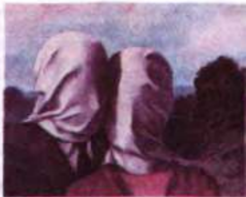
Р. Mazrimt. Закохані. 1928 р.

Процес навчання раніше нагадував проповідь монаха послушникам, для яких важливим був його особистий досвід і світобачення (згадаймо, який вплив справив на Ж. Сореля його вчитель, старий лікар армії Наполеона), то нині в конкурентну боротьбу за душі й уми людей (насамперед дітей і молоді) включається все інформаційне середовище: «від Інтернету й