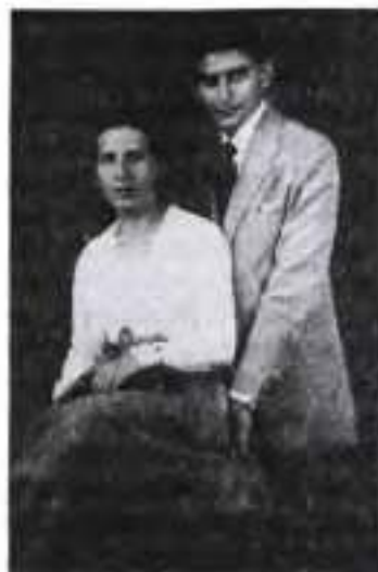
Франц Кафка з Феліцією Бауер

батьком здатність до волевиявлення, Ф. Кафка зберіг маніакальну знятність у відстоюванні власної творчої свободи. Ця сама жага творчої свободи й сформувала його звичку до самотності.