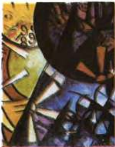
В. Маяковський. Рулетка. 1915 р.

футуристи, часом оберталася бунтом проти реальності.