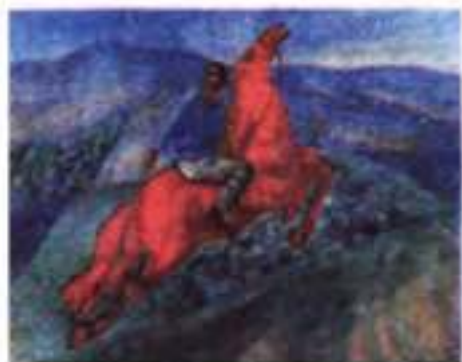
К. Петров-Водкін. Фантазія (Червоний вершник). 1926 р.

Якою ж є місія нової Росії («Росії-скіфа» чи «Росії-сфінкса»)? Яким є її місце у світі? Відповідь на це запитання дає епіграф до вірша. У XIX ст. вважалося, що Росія, яка єдина з-поміж слов'янських