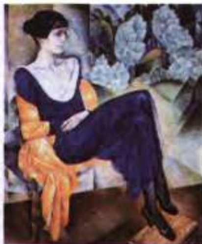
Н. Альтман. Портрет А. Ахматової. 1915 р.

У 1912 р. вийшла друком перша збірка А. Ахматової «Вечір» із передмовою авторитетного поета та перекладача М. Кузьміна. Він зазначив, що молодій поетесі відкривається «милий, радісний і сумний світ», але щільність психологічних переживань настільки сильна, що викликає передчуття майбутньої трагедії. У фрагментарних замальовках наголошується на дрібницях, конкретних аспектах нашого життя, що народжують відчуття гострої емоційності. Ці грані поетичного світосприймання А. Ахматової були співвіднесені критиками з тенденціями, характерними для нової поетичної школи. У її віршах побачили не лише відповідність духові