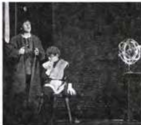
В. Висоцький у ролі Галілея. Театр на Таганці. 1966 р.

Уже після смерті Брехта, 15 січня 1957 р., у німецькому театрі «Берлінер ансамбль» відбулася прем'єра «Життя