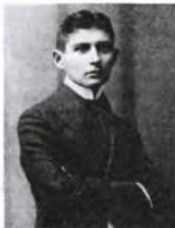
Франц Кафка замолоду

Подбала про неопубліковані рукописи Кафки М. Есенська (подібна ситуація виникне згодом із романом М. Булгакова «Майстер і Маргарита»). Узагалі «тема кохання» багато що пояснює в особистості Франца Кафки. Він був заручений кілька разів – з Феліцією Бауер (двічі) і Юлією Вохрицек. Його кохали й він кохав, але попри це щоразу тікав із-під вінця. Чому? Пояснення знаходимо в щоденнику письменника. Напередодні весілля з Феліцією він підбиває підсумок усього того, що свідчить «за» і «проти» одруження – сім пунктів. І «проти» перемагало: «Мені часто необхідно залишатися самому. Усе, що я зробив, є результатом усамітненості... Чи не буде (шлюб) на шкоду письменству? Тільки не це, тільки не це!» Потрібно зауважити, що, попри притлумлену