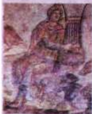
Орфей. Фрагмент мозаїки. III ст. н. е.

Орфей був противником пролиття людської крові й уявляв, що колись небо, земля і море були сполучені воедино, але потім посвярилися й розділилися. Йому приписують створення одного з найдавніших езотеричних учень, яке дійшло до нашого часу у фрагментах і отримало назву орфізм . Орфізм мав на меті за допомогою обрядів очищення (одним із способів такого очищення було мистецтво) і праведного орфічного способу життя спокотувати давній гріх титанів — невинесних противників світового порядку, що стало прокляттям для всього людства.