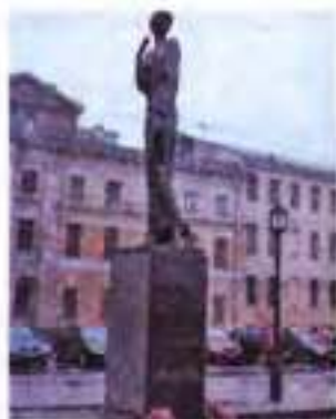
Пам'ятник А. Ахматовій. м. Санкт-Петербург (скульптор Г. Додонова, 2006 р.)

Звідки ж узялася така чоловіча сила вірша, простота його, грім слів неначе й звичайних, але разкотивших лунким похоронним подзвоном, що крають людське серце й викликають захват мистецький? Воїстину "томів громади важчий він". Написано двадцять років тому. Залишиться назавжди німотний вирок звірству» (Б. Зайцев. Париж, 1964 р. ).