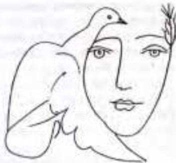
П. Пікассо. Ілюстрація до поеми Поля Елюара «Обличчя світу»

Вірш «Лорелея» (1904) входить до циклу «Рейнських віршів» зі збірки «Алкоголі». Уважається, що прообразом ліричної героїні «Рейнських віршів» стала Анні Плейден — по-справжньому велике