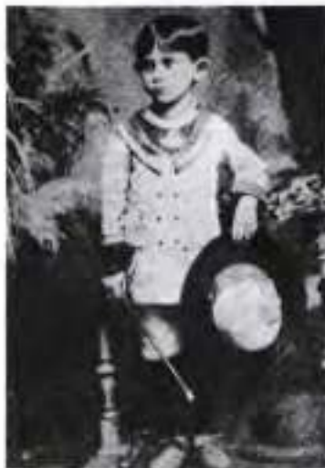
Франц Кафка в дитинстві

Франц Кафка народився в 1883 р. в єврейській родині в Празі, що була тоді одним із міст цієї імперії. Його духовною батьківщиною стала німецька культура — хлопчика віддали до німецької школи. Батько Франца, людина настирлива, із життєвою хваткою, вибився з бідності в галантерейні крамарі. Тиранічна батьківська вдача з дитинства пригнічувала волю хлопчика й позначилася на його психіці. Пізніше, у відомому «Листі до батька» (1919), Кафка