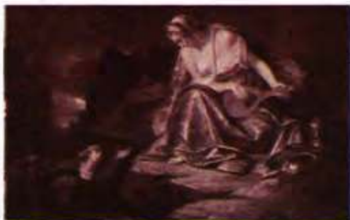
С. Бега. Лорелея. Початок XIX ст.

У циклі «Рейнські вірші» ще помітний вплив романтичної поезії XIX ст., особливо Г. Гейне. Історія гіркої любові Аполлінера перетворюється в цьому циклі (як і в «Книзі пісень» його великого німецького попередника) з події особистого життя на явище поезії. Сюжетною основою вірша «Лорелея» є легенда про рейнську красуню, яка своїм співом зачаровувала рибалок. У попередні епохи поети не раз зверталися до цього сюжету, розповідаючи свою історію трагічного кохання. Поміж них був і Г. Гейне («Не знаю, що стало зо мною...»), чий вірш став народною піснею. Якщо Гейне зосереджується на чарівно-згубному голосі Лорелеї, що «дикої пісні співає, неспіваної ніким», то Аполлінера цікавить передовсім доля таємничої красуні. За деякими переказами, саме біля скелі Лорелі (Лур-Ляй) підступні карлики-нібелунги ховали незліченні скарби — золото Рейну (про це яскраво повідав світові Р. Вагнер). Тож Лорелея виступала як жорстокосерда чарівниця, яка мала угоду з царем-демоном Рейну. Однак поміж романтиків більшою популярністю користувалася легенда про дівчину з чарівним голосом, небачену красуню, яка мстить за зрадливе кохання. Саме цей