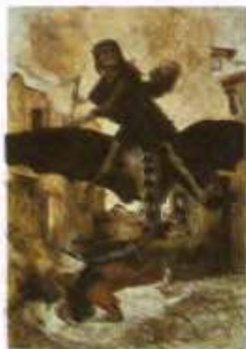
А. Беклін. Чума. 1898 р.

Якось Ріє викликав давній пацієнт, службовець мерії Жозеф Гран , якого лікар, з огляду на його бідність, лікував безкоштовно. Коттар (сусід Грана) чомусь намагався укоротити собі віку,