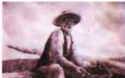
О. Петров, Кадр із мультфільму «Старий і море», 1999 р.