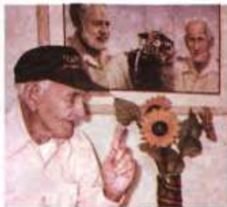
Григоріо Фуентес — один із прототипів старого Сантьяго з повісті «Старий і море» Е. Хемінгуей

Старий шкодує, що з ним немає хлопця, бо самому з такою величезною рибою впоратися важко. Протягом тривалого часу між рибою та людиною йшла справжнісінька битва. І ось нарешті старий переміг, упоравшись голіруч з озброєною мечем рибою, яка була довшою за його човен. Проте марлін завів човен далеко в море. Сантьяго потрібно не тільки зловити рибу, а з нею ще й доплисти до берега. На кров пораненого марліна до човна підпливають голодні велетенські акули й з'їдають здобич старого. Сантьяго відчайдушно відбивається, ризикуючи власним життям, убиває кількох хижачок, але сили занадто нерівні. Тож доки він доплив до берега від марліна залишився сам кістяк. Оце й увесь «зовнішній сюжет». Здавалося б: а що тут такого вже «глибинного», прихованого «під водою»?