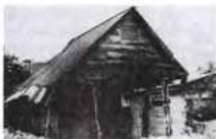
Будинок в м. Аракатаці, де народився Габріель Гарсія Маркес

Зі смертю дідуся у восьмирічного хлопчика розпочалося самотнє життя. Спочатку він навчався в Барранкільї, де почав писати вірші, а потім у суїтському лицей міста Сінакіра. Саме там сформувалися політичні уподобання письменника-соціаліста: «Викладач алгебри в лицей на перервах розповідав нам про історичний матеріалізм, хімік давав читати книги Леніна, а історик пояснював, що таке класова боротьба». А ще були пригодницькі романи, котрих хлопець перечитав безліч і які разом із дитячими спогадами допомогли сформулювати йому мистецьке кредо: «Романи повинні бути поетичною трансформацією дійсності».