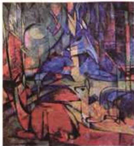
Ф. Марк. Олені в лісі. 1913–1914 рр.

Потрібно зауважити, що ці умо-настрої й тенденції найяскравіше втілилися в поезії, адже саме поети зазвичай стають першовідкривачами нових теренів літературної творчості. Роль «піонерів» поети відігравали і на початку ХХ ст. Романтичне й ранньомодерністське заперечення дійсності почало змінюватися на її художнє сприйняття, опанування. Звісно, йдеться не про соціально-політичні аспекти, а про вихід з «естетичного глухого кута».