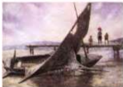
О. Петров. Кадр із мультфільму «Старий і море»

У повісті втілюються найхарактерніші особливості стилю Е. Хемінгуей: зовнішня простота, сувора об'єктивність, стриманий ліризм і глибинний змістовий підтекст – усі ці хемінгуейвські інтонації, що справили на сучасну прозу відчутний вплив.