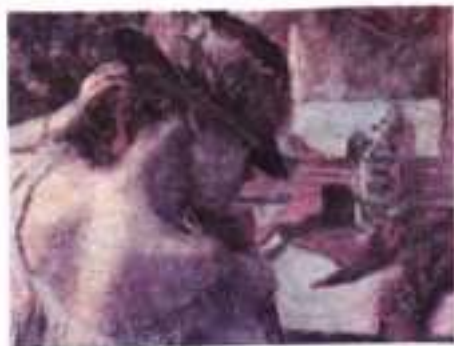
Е. Дега. Перед дзеркалом. 1899 р.

Так, на початку твору читаємо: «Хто? Бліде обличчя в обводі густо пахкого хутра. Рухи сором'язкі й нервові. Вона послуговується лорнетом»... Ми ще нічого не знаємо ані про місце дії, ані про героїв твору, але тут уже є підтекстовий натяк на театр — це слово «лорнет». Адже лорнетом називали різновид окулярів, який був популярним на межі XIX–XX ст. і за функцією відповідав театральному біноклю.