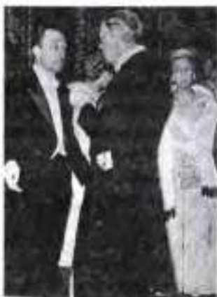
Альбер Камю на врученні Нобелівської премії. 1957 р.

Повоєнна ситуація у світі поставила перед людиною більше запитань, ніж дала відповідей. Колишні союзники ставали ворогами, а до жахів фашистських таборів долучилися жажливі розповіді про сталінський ГУЛАГ 1 . Коли Камю спостерігав за паризьким повстанням 1944 р., що визволило столицю Франції від фашизму, йому здавалося, що він присутній при «родових переїмах революції». Навіть газета «Комба», головним редактором якої був тоді письменник, вийшла з девізом «Від Опору до Революції!». Та швидко захоплення революцією не витримало аналізу філософа. У своєму творі (що його називали то есе, то памфлетом) «Бунтівна людина» (1951) Камю-філософ доходить висновку, що будь-яка революція неодмінно закінчується диктатурою, а «Прометей обов'язково вироджується в Цезаря». Вихід — лише в перманентному бунті, який відкидає владу, уособлення насильства й несправедливості. Значна частина лівої інтелігенції не прийняла філософських висновків А. Камю, а переважна більшість зрозуміла його: відкинувши фашизм, той не хотів йти до комунізму.