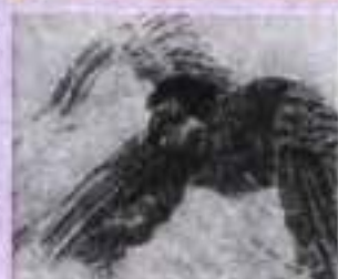
М. Врубель. Ілюстрації до поеми «Демон» М. Лермонтова

працею: дід, Андрій Бекетов, — відомий учений і громадський діяч; бабуся, Катерина Бекетова, — перекладачка з англійської, французької та інших європейських мов; тітки — поетеса Катерина Краснова, дитяча письменниця, і перекладачка Марія Бекетова (майбутній біограф Блока); та й мати поета, Олександра Блок (уроджена Бекетова), писала вірші. Усе це були люди обдаровані, широко освічені, які любили й розуміли слово. Тож майбутній поет від раннього дитинства жив в атмосфері яскравих культурних вражень. Неабиякий вплив на його формування справила російська поезія ХІХ ст.: вірші В. Жуковського, О. Пушкіна, М. Лермонтова, А. Фета, Ф. Тютчева, Я. Полонського.