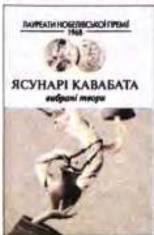
Обкладинка до вибраних творів Ясунарі Кавабати

Наприкінці 1950-х – у 1970-і роки в японській літературі з'являється велика кількість автобіографічних, побутових, детективних, історичних творів, а також творів, що характеризуються поглибленим вивченням психології людини (Ясунарі Кавабата, Юкіо Місіма, Кендзабуро Ое та ін.). Художній арсенал письменників цього часу становлять в основному прийоми авангардистської літератури.