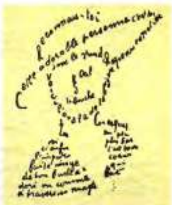
Каліграма Г. Аполлінера «Послання до Лу». 1915 р.

Цікавою є ідейно-тематична еволюція творів, що входять до «Каліграм»: якщо перші його «воєнні» вірші (наприклад, «Послання до Лу», 1915) сповнені ненависті до Німеччини (ворога Франції в Першій світовій війні), то в наступних відбулася еволюція щодо засудження війни як такої.