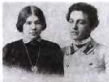
Любов та Олександр Блоки. Вівчальна фотографія. 1903 р.

Усе це зумовило його творчий злет. Період учнівства увінчався створенням