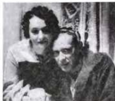
Олена та Михайло Булгакови. 1936 р.

28 березня 1930 р., у хвилину відчаю, письменник написав лист до уряду СРСР, що звучав як палка