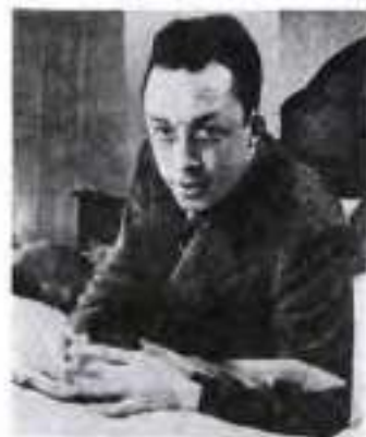
Альбер Камю. 1956 р.

Особливості стилю роману підкреслюють послідовність розвитку творчої манери А. Камю та продовження ним традицій поширеного в новітній інтелектуальній прозі жанру, який відзначається універсальністю змісту. «Чума» алегорична, як стародавні міфи чи Біблія, але на відміну від стародавніх притч, які тяжіли до прямолінійних алегорій, роман відзначається смисловою багатозначністю. Отже, твір А. Камю наближається до міфу, і водночас — це роман-попередження, роман-пересторога, що також робить його явищем позачасовим і загальнолюдським.