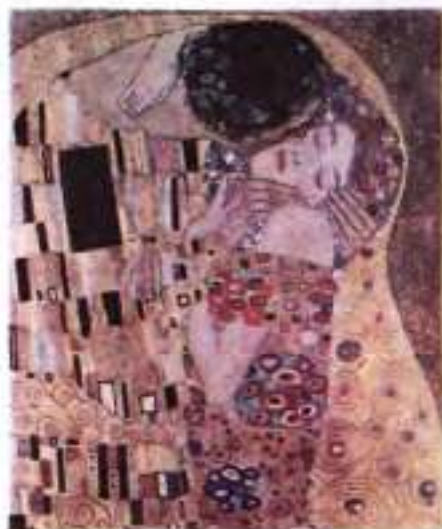
Г. Клімт. Поцілунок. Фрагмент. 1907–1908 рр.

Письменник показує закоханість свого героя в молоду жінку, якій той давав уроки англійської мови. У Трієсті