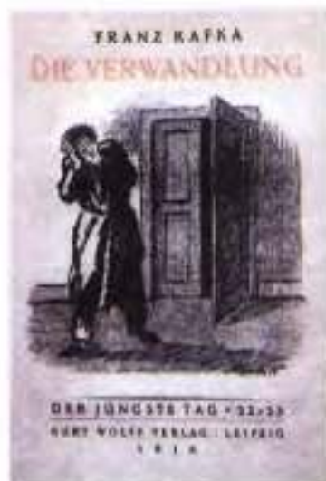
Обкладинка першого видання оповідання «Перевтілення» Ф. Кафки. 1916 р.

про її суспільний устрій. Хіба що деякі штрихи вказують саме на буржуазне суспільство: Грегор — комівояжер, батько його розорився тощо.