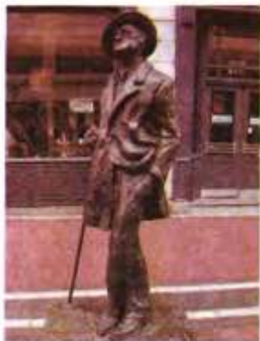
Пам'ятник Д. Джойсу, м. Дублін (скульптор М. Фіцджеральд, 1990 р.)

За рішенням ЮНЕСКО в усьому світі урочисто відзначили сторіччя з дня народження письменника. В ювілейному списку Комітету значилося: «Джеймс Джойс — класик ірландської літератури ХХ ст., майстер психологічно товких новел у збірці оповідань "Дублінці"». Цікаво, чи усвідомили колишні діячі ірландського літературного відродження, що саме Джойс, а не вони принесли літературі їхньої країни всевітнє визнання.