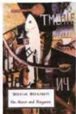
Обкладинка до роману «Майстер і Маргарита» М. Булгакова