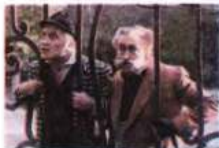
Кадри із кінофільму «Майстер і Маргарита» (режисер Ю. Кара, 1994 р.)

з одного боку, мертве закривавлене тіло Берліоза, а з іншого – танці в ресторані. Байдужість до чужого горя ще більше підкреслює смакування гастрономічних чудес і розгульне бенкетування. Відчай проникає в душу автора: «О боги, боги мої, отрути мені, отрути!»