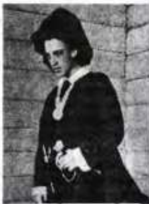
Олександр Блок у ролі Гамлета. 1898 р.