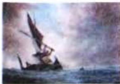
О. Петров. Кадр із мультфільму «Старий і море». 1999 р.

Почнемо з того, що конкретні образи (старого, моря, риби, хлопчика, левів, акул, сонця, місяця, зірок, човна, вітрила і т. д.) набувають у повісті притчового, філософсько-символічного звучання. Усі ці символи волею письменника опиняються в ситуації напруженого протистояння й нерозривної єдності одночасно. Так стверджується думка про взаємозв'язок усього живого на Землі: людей, тварин, птахів, риб... Водночас вияскравлюється один із парадоксів життя «як воно є»: для прожиття людина іноді змушена полювати на ті живі створіння, яких любить, убивати їх. «Добре, що нам не треба замірятися вбити сонце, місяць чи зорі, – розмірковує старий рибалка, який фактично все життя займався рибною ловлею, – досить і того, що ми живемо біля моря й убиваємо своїх щирих братів».