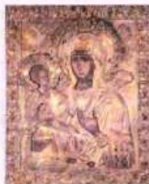
Божа Матір Тросручниця. Ікона. XIV ст.