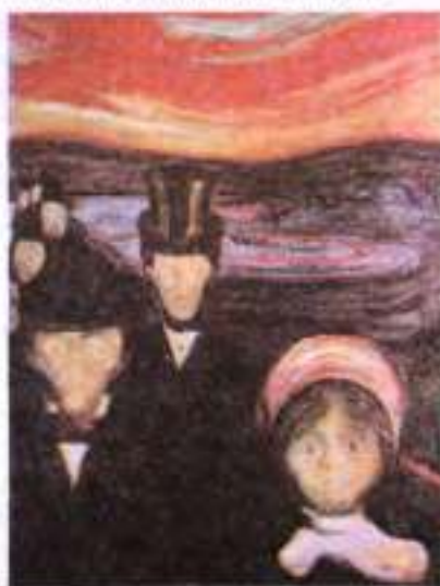
Мунк. Страх. 1884 р.

Натомість початок ХХ ст. (10–20-і роки) ознаменований переходом від раннього до зрілого модернізму . У чому ж полягала принципова різниця між раннім і зрілим модернізмом? Насамперед можна пригадати суттєві розбіжності в ставленні до дійсності, до реального життя з його проблемами. Так, ранній модернізм успадкував від романтизму презирливе ставлення до «нищої, сірої, нецікавої» дійсності. Яскравим прикладом є протиставлення «двох світів» у Е. Т. А. Гофмана – його герої тікають зі світу філістерів до світу ентузіастів. Це неприйняття «буденності», негативне ставлення до дійсності, протиставлення їй культу краси й мистецтва, які покликані «тягар життя... зробити легшим, а всесвіт – менш гидким!», червоною ниткою пронизує творчість багатьох письменників другої половини й особливо наприкінці ХІХ ст. (Ш. Бодлер, П. Верлен, А. Рембо, О. Уайльд та ін.).