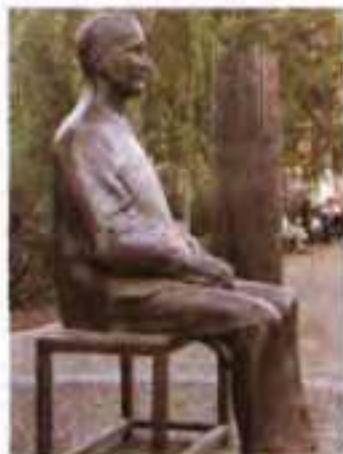
Пам'ятник Б. Брехту. м. Берлін (скульптор Ф. Кремер, 1957 р.)

Нарешті він мав змогу створити власний театр і реалізувати себе і як режисер, і як драматург, і як громадський діяч (1950 р. його обрано віце-президентом Академії мистецтв Німецької Демократичної Республіки). Вистави брехтівського «Берлінер ансамблю» мали неабиякий успіх, їх вітали театралі Європи. Популярність письменника зростала. За кордоном починали з'являтися театри, що за технікою проголошували себе брехтівськими. Зокрема, треба згадати Грузинський театр імені Шота Руставелі, що неодноразово приїздив в Україну, візитівкою якого стала