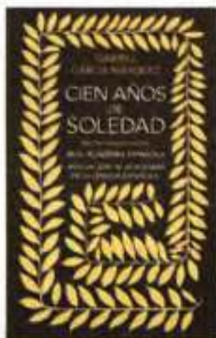
Обкладинка до роману «Сто років самотності» Габрієля Гарсія Маркеса