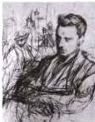
Л. Пастернак. Райпер Марія Рільке. 1899 р.

потоваришував з художником-імпресіоністом Л. Пастернаком і з професором-мистецтвознавцем І. Цветаєвим, неодноразово бував у них удома, познайомився з їхніми дітьми і навіть не здогадувався, що через чверть століття назве листування з талановитими поетами М. Цветаєвою і Б. Пастернаком «блуканням трьох душ, трьох зірок на небосхилі Всесвіту» . Під час другої подорожі Російською імперією Рільке вирішив відвідати Україну. Як писав він у листі до Л. Пастернака, «в очікуванні майбутньої подорожі я почуваю себе так, неначе дитина перед Різдвяними святами».