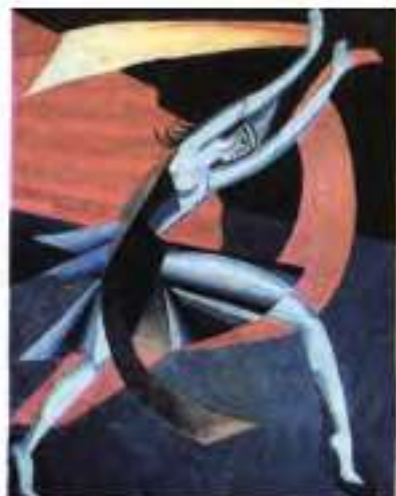
О. Екстер. Ескіз костюма Саломеї. 1917 р.

Та чи не найбільшим шоком для людства стало запитання, на яке досі не знайдено відповіді: як Німеччина, країна, що подарувала людству таких геніїв духу і думки, як М. Лютер та І. Кант, Й. В. Гете і Ф. Шиллер, Л. ван Бетховен і Й. С. Бах, А. Ейнштейн і Р. Дизель, могла впродовж 1939–1945 рр. здійснювати злочини не лише проти людства , а й проти людяності .