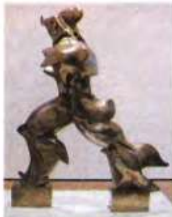
У. Боччоні. Унікальні форми безперервності в просторі. 1913 р.

поділяючи окремі положення футуризму, багато в чому були суголосними з іншими течіями: егофутуристи пов'язані з акмеїстами, а мезоністи провістили появу імажиністів (В. Шершеневич став одним із лідерів імажиністів).