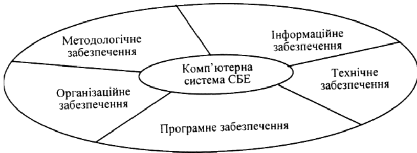
Рис. 3.3. Складові комп'ютерної системи

- об'єднання персональних комп'ютерів у локальну мережу з одним або кількома потужними комп'ютерами (серверами) та вихід до глобальних мереж (зокрема Інтернет).