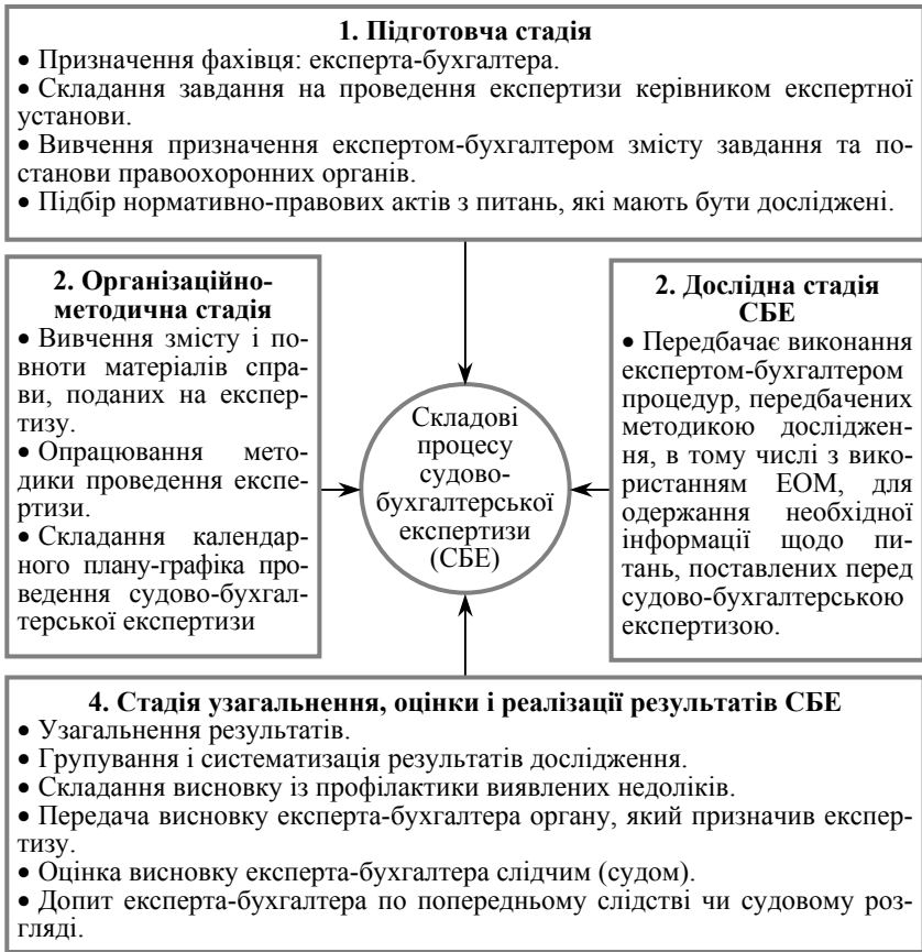
Рис. 3.1. Стадії процесу судово-економічної експертизи

Залежно від спеціалізації і рівня підготовки їм присвоюють кваліфікацію судового експерта з дозволом проведення певного виду експертиз і кваліфікаційний клас.