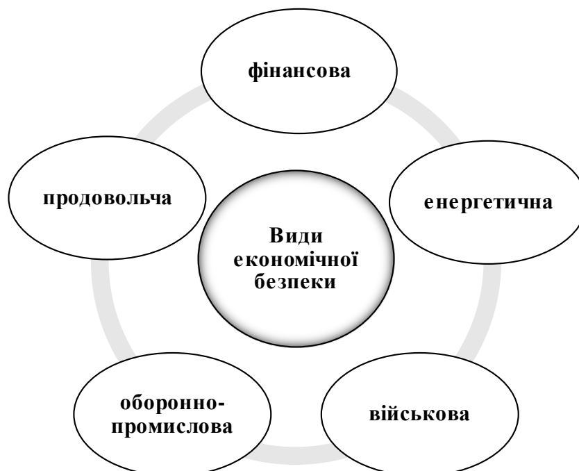
Рис. 1.2. Види економічної безпеки

Здатність до саморозвитку і прогресу, що особливо важливо в сучасному, динамічному світі, створення сприятливого клімату для інвестицій і інновацій, постійна модернізація виробництва, підвищення професійного, освітнього і загальнокультурного рівня працівників стають необхідними й обов'язковими умовами стійкості і самозбереження національної економіки.