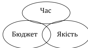
Рис. 9.4. Складові проєктного менеджера