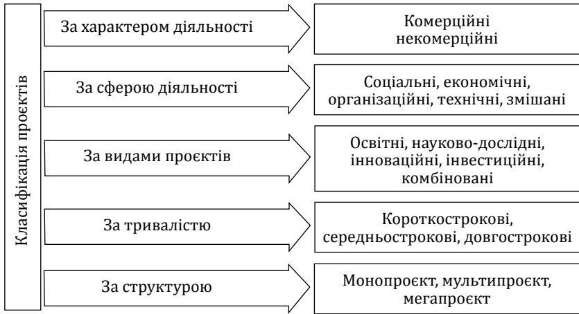
Рис. 9.3. Види проєктів