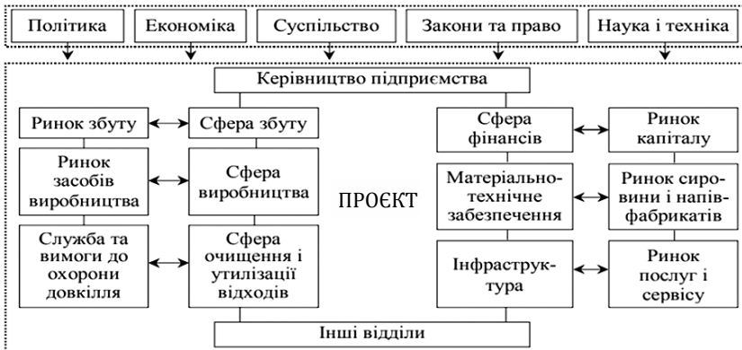
Рис. 9.2. Схема середовища проєкту