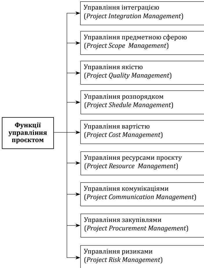
Рис. 9.6. Функції управління інвестиційними проектами