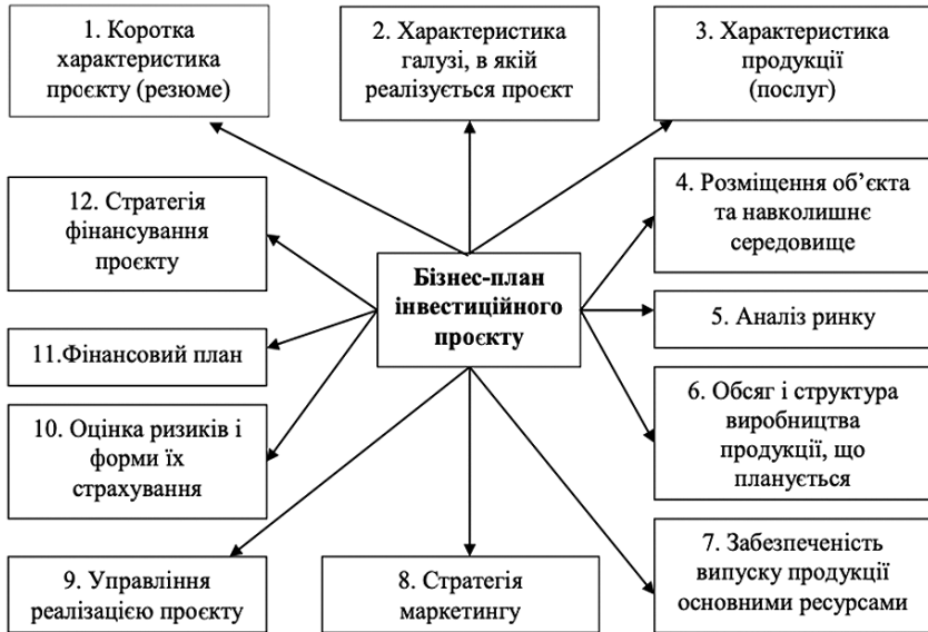
Рис. 9.9. Розділи бізнес-плану інвестиційного проекту 109