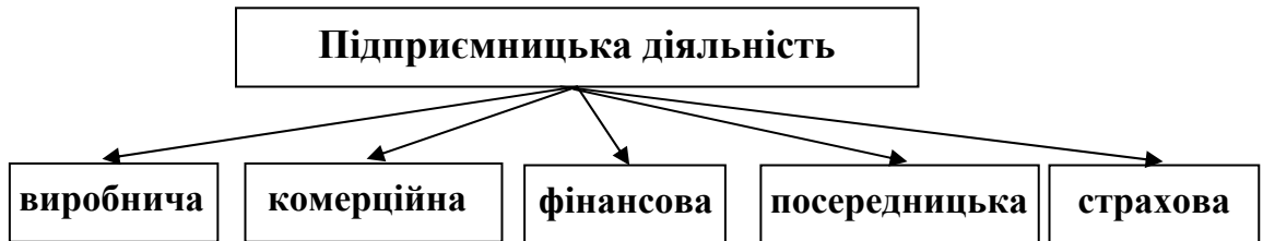
Рис. 1.1. Види підприємницької діяльності